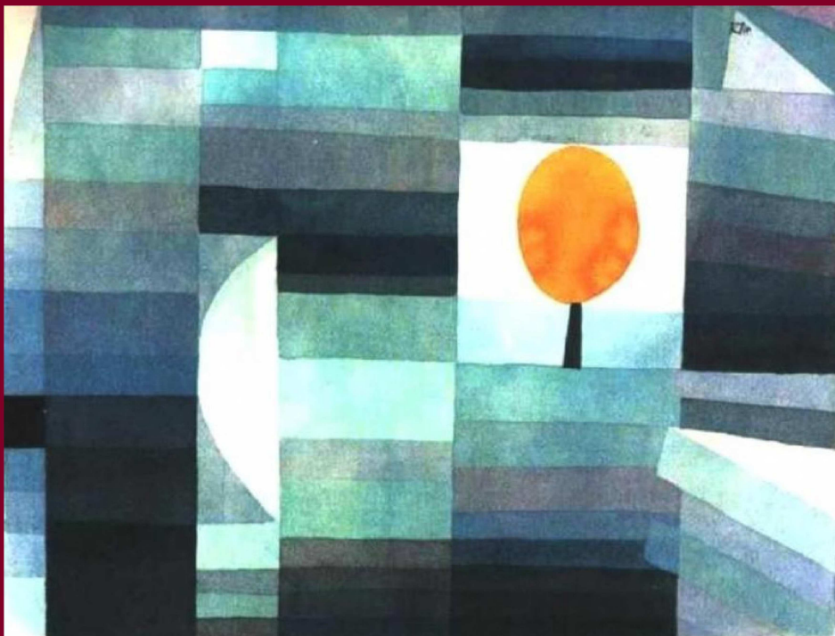
AZ ŐSZ HÍRNÖKE (1922)