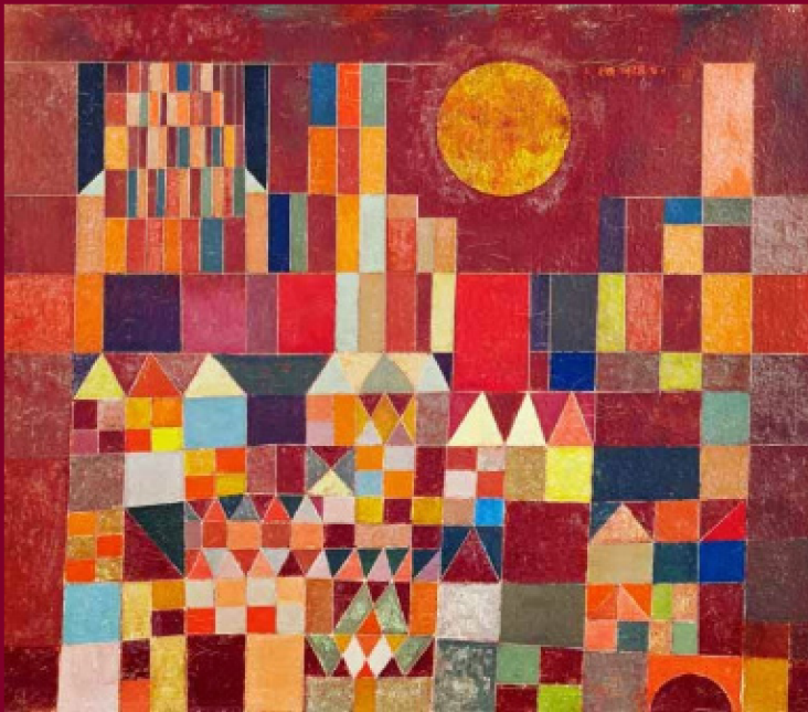
VÁR ÉS NAP (1929)

Autizmus? Mégis mi az? Betegség vagy állapot? Kérdezd meg az autistát, hogyan megkapd a válaszod. Ki autista, nem beteg, csak másképpen működik. Te sem gondolsz ugyanarra, amin a másik tűnődik. Sportol, tanul, érdeklődik, megismeri a világot, eközben meg megőrül, ha meglátja a MÁV-ot. Csúfolják, mert más, vagy azért, mert hasonló, azt viszont nem sejtik, hogyan a szavak ereje romboló. De még mindig jobb, ha egy gyerek gúnyolja, mint ha a felnőtt a kisegítőbe tuszkolja.