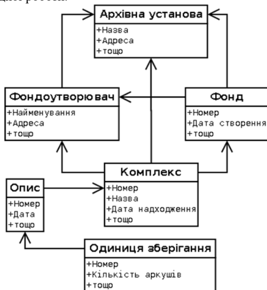
Рис. 1. Приклад можливої об'єктної моделі ПЗ Елфа

На рис. 1 ієрархія об'єктної моделі починається з архівної установи. Це лише приклад, реальну об'єктну модель автори створили на підставі науково-дослідної роботи [11] у співпраці з ЦДНТА України. Ніщо не заважає побудувати об'єктну модель таким чином, щоб ієрархія починалася з Державної архівної служби України. У цьому випадку у ПЗ Елфа буде обліковано архівні документи всіх архівних установ. Але побудова такої об'єктної моделі потребує окремої науково-дослідної роботи.