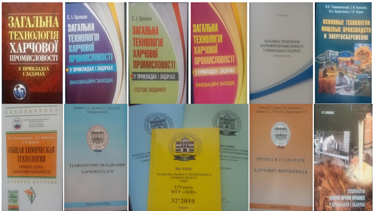
Рис. 1 – Приклади інтелектуальної власності дистанційної освіти

навчальних закладів (ВНЗ), курсів та факультетів [6–20], а також видано більш ніж 20 навчальних посібників та підручників з грифом МОН України (рис. 1).