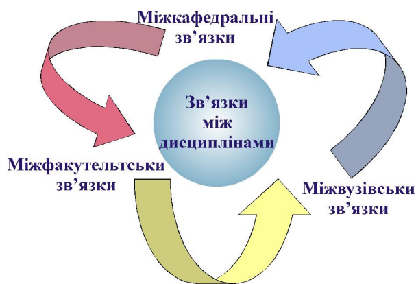
Рис. 2. Области вдосконалення навчання

Удосконалення методичного забезпечення дистанційного навчання пов'язане з визначенням та встановленням зв'язків між дисциплінами внутрішніми у самому ВНЗ та зовнішніми – міжвузівські з метою систематичного розширення заходів з потенційно цікавим і методично-обґрунтованим навчальним матеріалом для освіти (рис. 2).