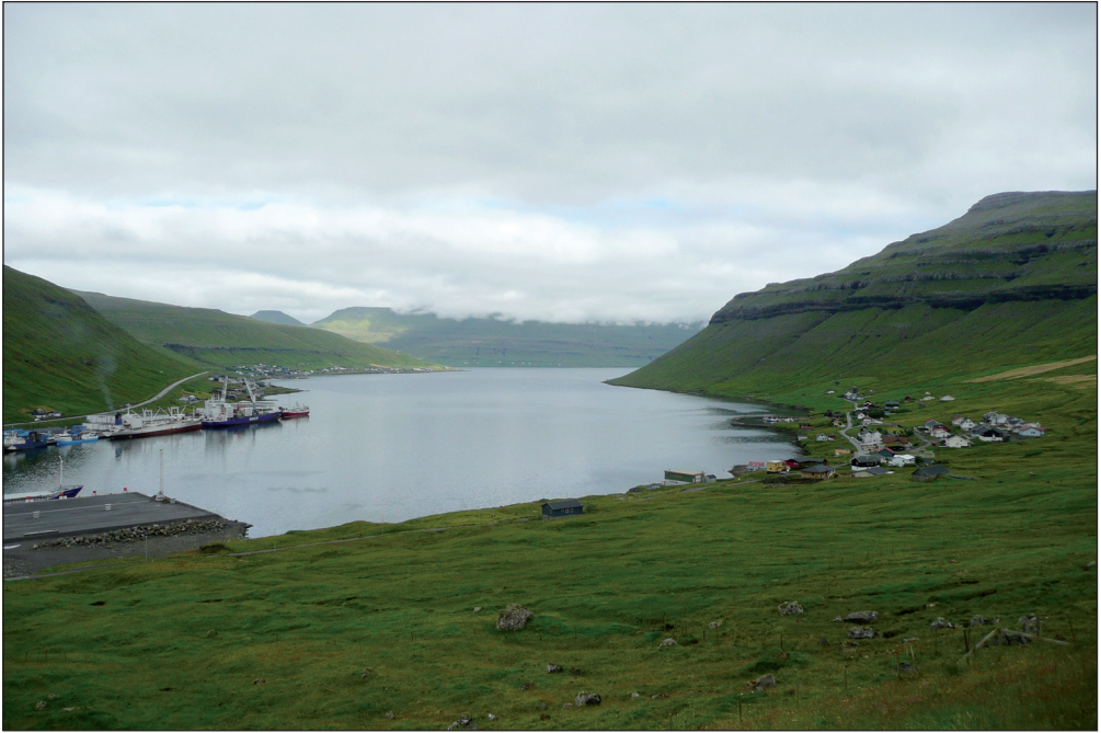
Fig. 1. Kollafjørður (tv) og Signabøur (th), Streymoy, Færøerne. Bemærk færgelejet. Foto: Jens-Kjeld Jensen, 05.VII.2010.

Kollafjørður (left) and Signabøur (right), Streymoy, Faroe Islands. Note the ferry berth. Photo: Jens-Kjeld Jensen, 05.VII.2010.