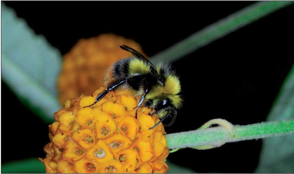
Fig. 4. Han af Bombus pratorum (Linnaeus, 1761) på sommerfuglebusk ( Buddleia globosa ) ved Signabøur, Streymoy, Færøerne. Foto: Jens-Kjeld Jensen, 05.VII.2010.

Male Bombus pratorum (Linnaeus, 1761) on Orange Ball Tree ( Buddleia globosa ) at Signabøur, Streymoy, Faroe Islands. Photo: Jens-Kjeld Jensen, 05.VII.2010.