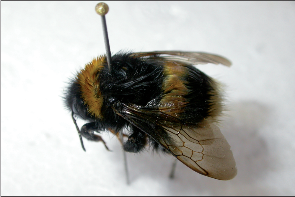
Fig. 2. Dronning af Bombus lucorum (Linnaeus, 1761), Skálafjørður, Eysturoy, Færøerne. Foto: Jens-Kjeld Jensen, 26.VIII.2007.

Female (queen) Bombus lucorum (Linnaeus, 1761), Skálafjørður, Eysturoy, Faroe Islands. Photo: Jens-Kjeld Jensen, 26.VIII.2007.