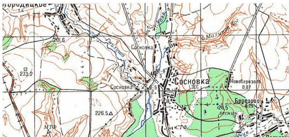
Рис. 2.1 Схема расположения исследуемого района

Исследуемый участок обнаруживается на земли Старороговского сельского совета в Горшеченском регионе Курской области (рис. 2.1).