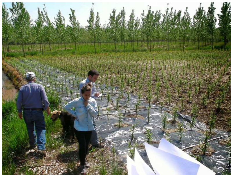
Figura 2. Estación experimental agropecuaria, delta del Paraná.