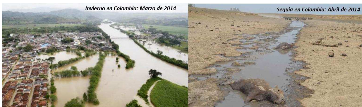
Figura 3. Izquierda: Inundaciones, y Derecha: Sequías en Colombia.