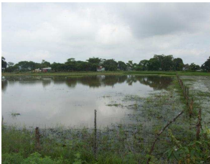
Figura 4. Sequías e inundaciones en Ecuador, caso de estudio, Hacienda: Isla Isabel, provincia del Guayas, en Arriba : noviembre 2013, y Abajo : junio 2014 respectivamente.

El caso de estudio de Brasil se relaciona a las lluvias de gran intensidad de enero de 2011, las cuales golpearon la región montañosa del Estado de Río de Janeiro, donde se consideró específicamente los