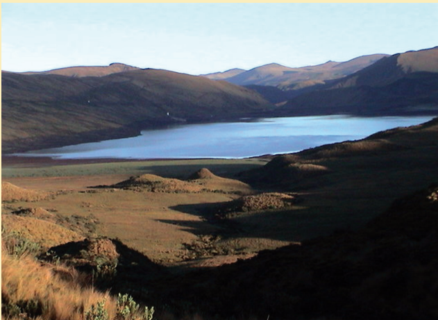
Figura 1. Laguna de Pisayambo que refiere el sitio geográfico donde se localiza el cluster sísmico del mismo nombre.

Dado que en el Ecuador existe una zona de gran actividad sísmica: el cluster de Pisayambo (Araujo et al. , 2009), el interés práctico estará dirigido posteriormente a la aplicación de un programa software de tomografía sísmica a los sismos producidos en Pisayambo (Figura 1).