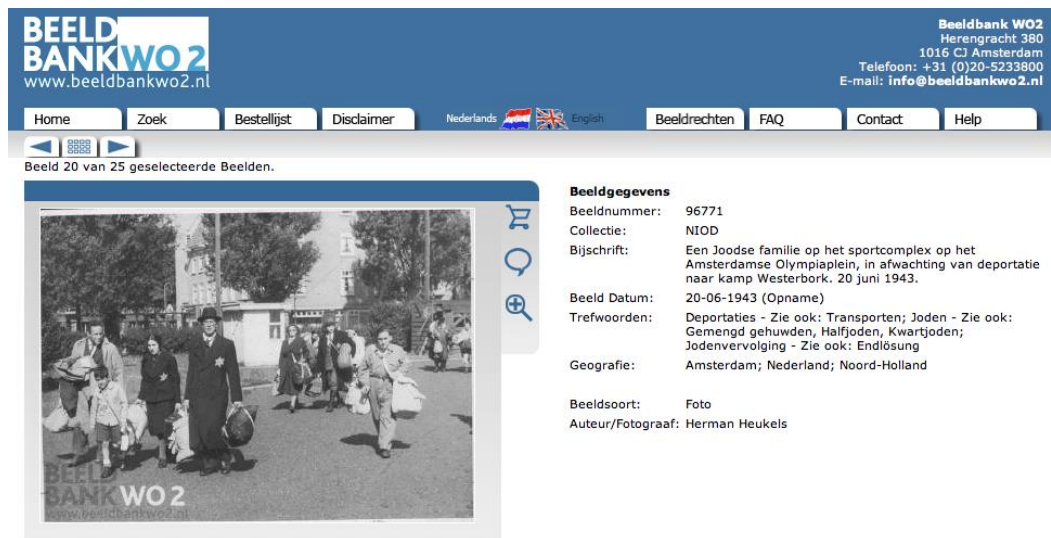
Abb.1: Deportation von Juden aus Amsterdam am 20. Juni 1943. Nach den Angaben des NIOD in der Bilddatenbank handelt es sich um eine jüdische Familie auf dem Weg zur Sammelstelle auf dem Sportkomplex des Olympiaplein. 23

vage. 21 Erst die Webseite des United States Holocaust Memorial Museum in Washington enthält schließlich den entscheidenden Hinweis auf das Originaldokument, das sich in der Sammlung des Instituut voor Oorlogs-, Holocaust- en Genocidestudies (NIOD) in Amsterdam befindet. 22