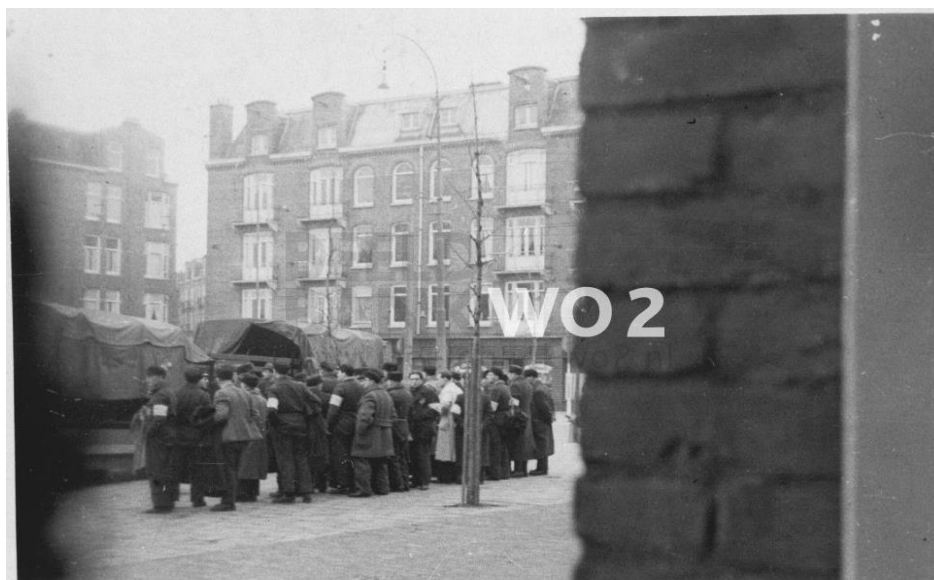
Abb. 3: Heimlich aufgenommenes Foto der Deportation am 20. Juni 1943. Razzia in den frühen Morgenstunden im Stadtviertel Transvaalbuurt in Amsterdam Oost. 28

tanz, aus der Deckung eines Hauseinganges oder von Balkonen aufgenommen.