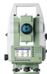
SLIKA 3. 2. Leica TCRP 1201