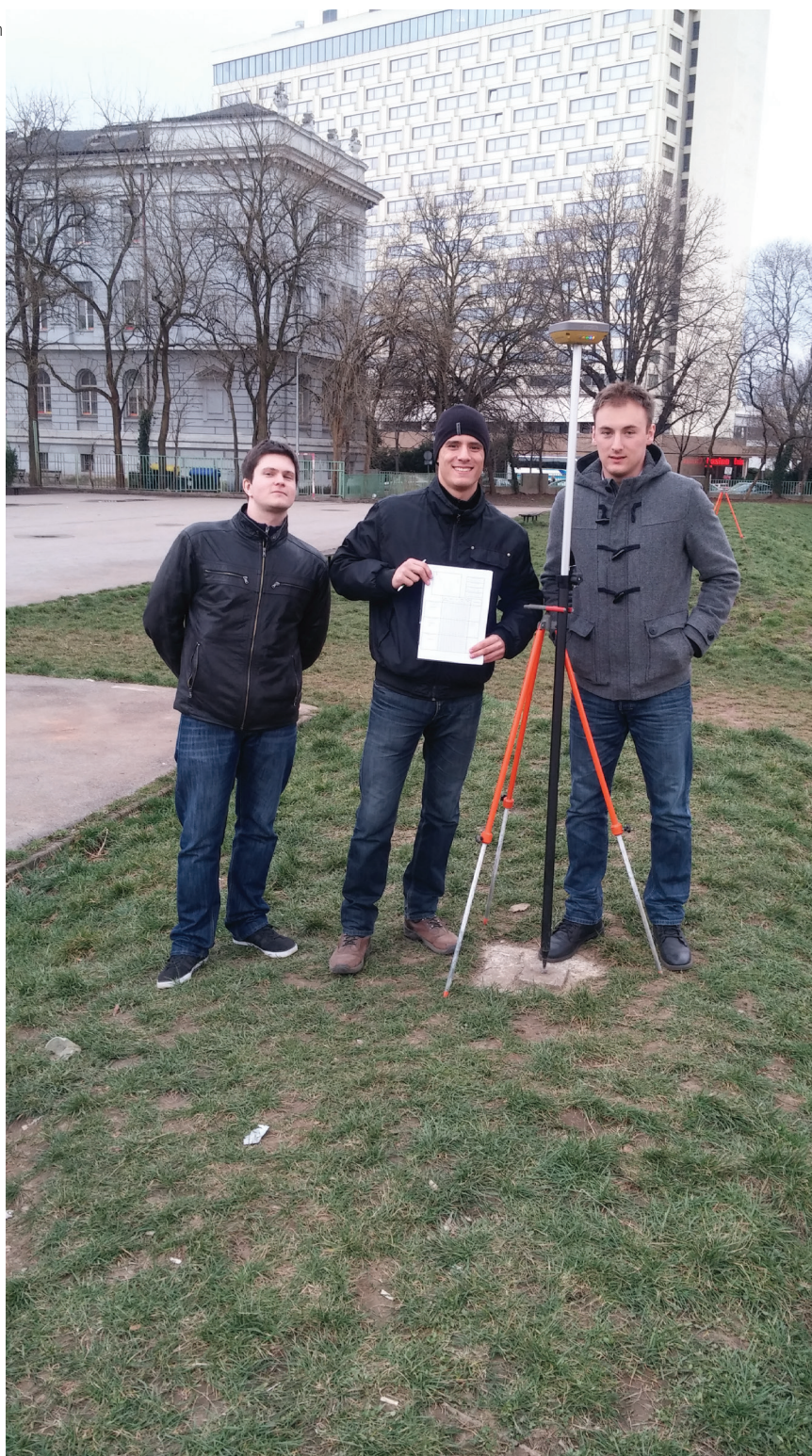
Slika 8. 1. Sudionici radionice

+ URL-3: Topcon HiPer SR User Manual, [Internet]; <raspoloživo na: http://www.topconpositioning.com/sites/default/files/HiPer_SR_7010_2108_RevB_TF_sm.pdf >, [pristupljeno 21. ožujka 2015.].