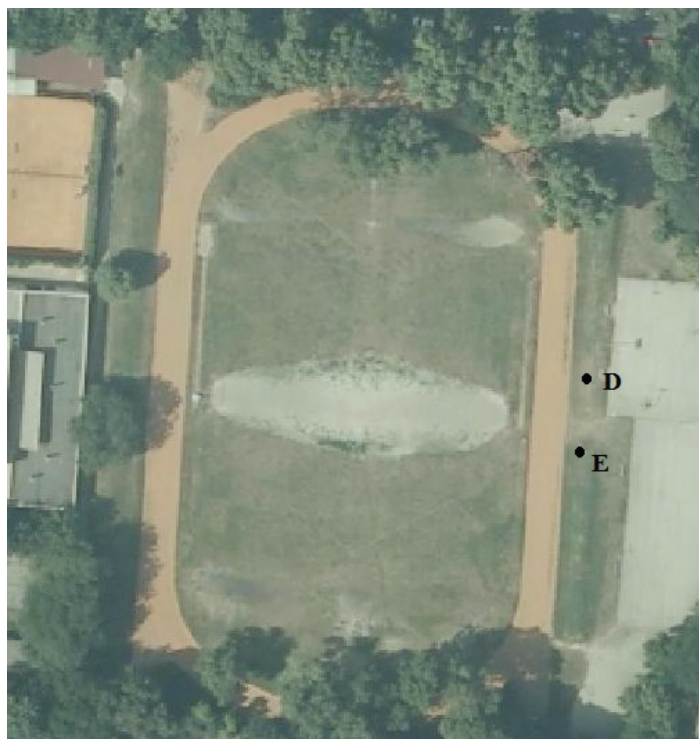
SLIKA 2. 1. Lokacija provedbe ispitivanja

mjerenu duljina (2 mm + 2 ppm), korištena je kako bi se odredila horizontalna duljina između dviju odabranih točaka. Kako bi se postigla tražena preciznost mjerenja duljine (3 mm) definirana normom, korištena je mini prizma. S istom preciznošću trebalo je odrediti i visinsku razliku te je korišten precizni nivelir Wild NA2 s planparalelnom pločom te invarna letva s jednostrukom podjelom, čime je bez poteškoća moguće ostvariti