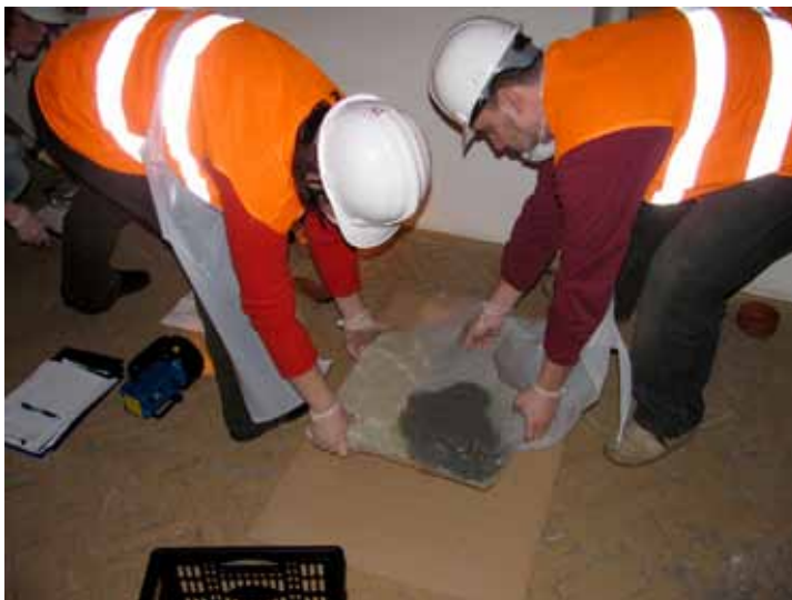
Slika 4. Poduka u području reagiranja u izvanrednim okolnostima kao dio preventivne konzervacije

Iduće razdoblje u razvoju preventivne konzervacije obilježilo je prihvaćanje pristupa u ustanovama zaštite i strukovnim udruženjima, kao i usvajanje koncepta čimbenika propadanja, odnosno jasno određenih elemenata koji čine uvjete okoliša u muzejima, planiranje za izvanredna stanja, sigurnost, zaštitu od požara i mjere kurativne konzervacije (fizičke sile, krađa i vandalizam, vatra, voda, štetočine, zagađivači, svjetlosno zračenje, neodgovarajuća temperatura i relativna vlažnost), kao i koncepta zona i razine nadzora (Michalski 1990). U sklopu pet razina nadzora: izbjeći izvor čimbenika propadanja, otkriti čimbenik propadanja, zaustaviti čimbenik propadanja, reagirati na čimbenik propadanja i tretirati predmet, prve četiri su zapravo aktivnosti preventivne konzervacije. Šest godina kasnije, na Jedanaestom trijenalnom skupu ICOM CC u Edinburghu, 1996. godine, prvi put nekoliko različitih radnih skupina koje su se bavile odvojeno temama preventivne konzervacije, kao što su osvjetljenje, praćenje klime, štetočine, zaštita od požara, postaju jedna radna skupina – Preventivna konzervacija.