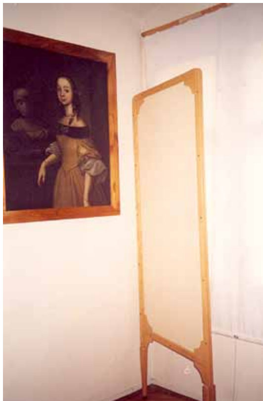
Slika 2. Blokiranje djelovanja svjetlosnog zračenja na sliku postavljanjem panela

odgovarajućih uvjeta čuvanja zbirki (Caygill 1992). Pored relativne vlažnosti, H. Plenderleith, kao uzroke oštećenja muzejskih predmeta uzima u obzir i zagađeni zrak i zanemarivanje predmeta, što za posljedicu ima loše uvjete čuvanja, izlaganja, pojavu štetočina, loše rukovanje i pakovanje, kao i nesreće s predmetima (Plenderleith 1956). To prvo razdoblje u razvoju preventivne konzervacije obilježeno je održavanjem dviju konferencija i objavljivanjem publikacija koje su ukazale na problematiku nadzora klimatskih uvjeta u muzejima, štetnih posljedica i suzbijanja insekata i mikroorganizama i promovirale pristup nadzora i regulacije klimatskih uvjeta i svjetlosnog zračenja u muzejima da bi se spriječilo propadanje predmeta (Recent Advances in Conservation 1961, Museum Climatology 1967, Pye 2001, Thomson 1978).