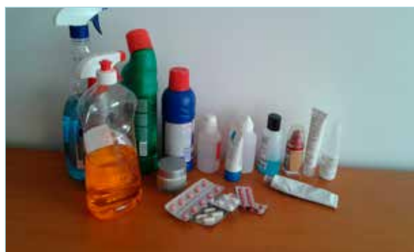
Slika 1: Neki od proizvoda čiji sastojci dospijem u okoliš predstavljaju nove onečišćujuće tvari.

Otpadne vode osim jednostavnih sadrže i mješavinu specifičnih organskih sastojaka, tzv. ksenobiotika kao što su: farmaceutski proizvodi, pesticidi, sredstva osobne higijene i brojni drugi sastojci kompleksne strukture. U otpadnoj vodi može biti velik broj takvih specifičnih onečišćujućih tvari, a ako se ne pročišćavaju postupkom primjerenim za njihovo uklanjanje, nosintetizirani organski sastojci bivaju, zahvaljujući svojoj biorezistenciji, ispušteni u izlazni tok obrađene otpadne vode biološki nerazgrađeni. Njihova teško biorazgrađiva, ksenobiotska priroda podrazumijeva strukture koje prirodno postojani mikroorganizmi ne mogu metabolizirati uporabivši ih kao hranjivo, što nadalje omogućuje njihovu postojanost i akumuliranje u okolišu. Time doprinose ekološkom problemu globalnih razmjera uvjetujući pojavu štetnosti na brojnim biološkim vrstama. Iako se danas mnogo zna o fiziološkim i toksičnim svojstvima velikog broja opasnih i po žive organizme štetnih tvari, njihovom porijeklu, načinu i putovima djelovanja, te procesima