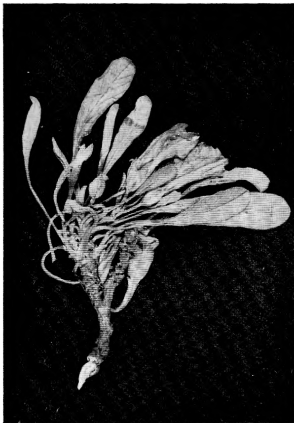
Sl. 1. (Abb. 1) — Convolvulus lineatus L. sa otočicia Purara