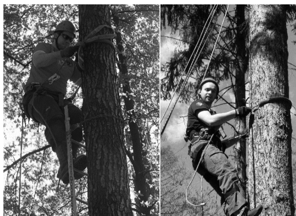
Slika 4. Načini penjanja na stablo radi montiranja sedla Fig. 4 Methods of climbing on tree for mounting the anchor