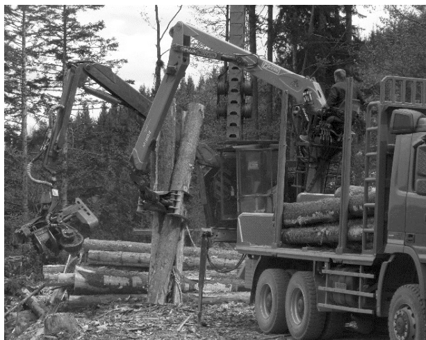
Slika 7. Rad žičare Mounty 4000 Fig. 7 Operation of the cableway Mounty 4000