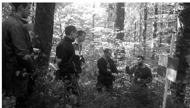
Slika 2. Snimanje terenskih podataka na koridoru šumske žičare Fig. 2 Field survey on forest cableway corridor