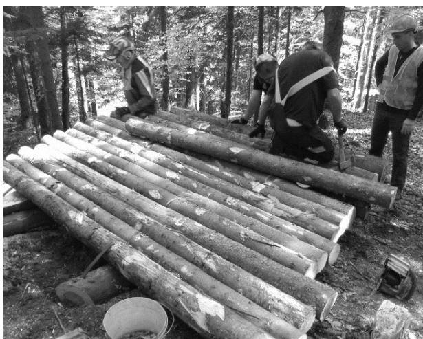
Slika 5. Izrada platforme za vitlo Gantner Fig. 5 Making a platform for Gantner winch