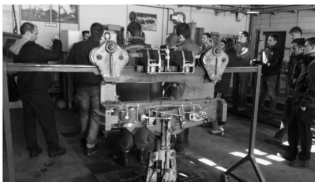
Slika 1. Prezentacija različitih modela nosivih kočija za šumske žičare Fig. 1 Presentation of different models carriages for forest cableways

sobljavanja, tj. u centru za obuku. Nadalje, upoznate su tehnike sastavljanja komponenti različitih modela šumskih žičara, obrađivani elementi važni za unaprjeđenje rada sa šumskom žičarom i dr. Radionica je obuhvatila uredski i terenski rad čime se dobila potpuna slika od samoga planiranja postavljanja trase šumske žičare u prostor na najpogodnije mjesto do finalne realizacije zamišljenoga projekta. U sklopu radionice u privatnoj šumi obitelji Foscari-Widmann-Rezzonico prikazan je i rad kamionske žičare s procesorskom glavom.