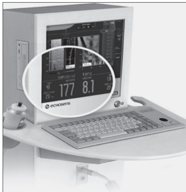
Sl. 1. Monitor TE aparata

TE je uređaj s mehaničkim vibratorom vezanim za ultrazvučni odašiljač koji, prislonjen uz interkostalni prostor, odašilje mehanički impuls u jetru. Brzinu širenja detektira ultrazvučna sonda na temelju doplerskog učinka te izračunava vrijednost izraženu u kPa, prema jednadžbi za Youngov modul elastičnosti (LSM engl. " Liver Stiffness Measurement "). Zbog poboljšanja točnosti testa potrebno je učiniti minimalno 10 valjanih očitavanja u jednoj pretrazi (7). Budući da je fibrozno tkivo tvrđe od normalnoga tkiva jetre, stupanj jetrene fibroze interferira s jetrenom tvrdoćom. Izgled jednog od aparata TE prikazan je na sl. 1.