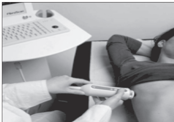
Sl. 3. Način izvođenja pretrage TE

Potpuno je bezbolna, a pacijent osjeti lagano strujanje ili vibriranje na koži svaki put kad se sonda uključi. Pacijent ne bi smio uzimati hranu minimalno 2 sata prije pretrage.