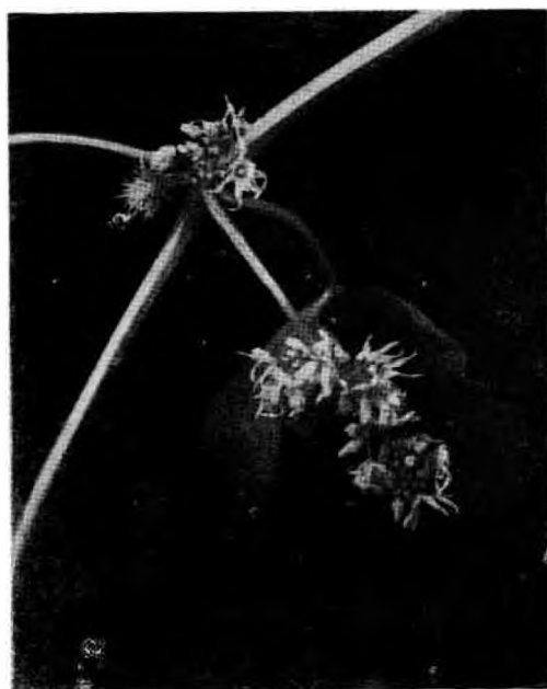
Sl. 2 Fig. 2