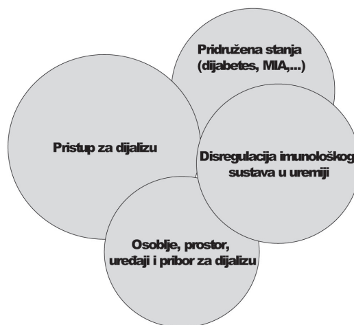
Sl. 1. Patogenetski i epidemiološki čimbenici vezani uz infekcije na dijalizi (adaptirano prema ref. 4 i 5)