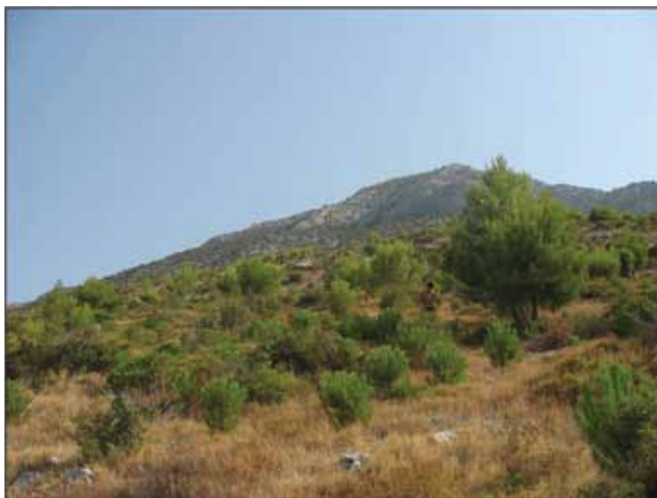
Slika 5. - Pokusna ploha 4.

Ovdje je 1994.-1995. podignuta kultura alepskog bora sjetvom sjemena. Ista se prilično dobro razvijala do ponovnog požara koji ju je napao 2001. Taj požar je u većini uništio kulturu, ali su mjestimično preostale skupine ili pojedina stabla koja nisu nastradala. Opožarene površine su pošumljene sadnjom kontejnerskih sadnica pinije (1+0) u jame. Pošumljavanje je vršeno u jesen 2001., s oko 2000 sadnica po ha, a na proljeće 2002. je slijedilo popunjavanje. Nakon pet godina primitak je oko sedamdeset posto, što je za ovakav teren vrlo uspješno i stabilca se polako ali sigurno razvijaju. Primijećena su i pojedina stabalca pomladka alepskog bora, čija je obnova bila prirodna, od naleta sjemena sa strane i od ostataka prethodne kulture. Za očekivati je da će se zbog svojih skromnih ekoloških zahtjeva njegov udio s vremenom povećavati. Od autohtone vegetacije, nakon požara se iz panja najbolje oporavlja zelenika, a značajni su još i crni jasen i tršlja. U budućnosti će se ova sastojina razviti u lijepu mješovitu borovu (pinija i alepski) sastojinu s elementima listača u donjoj etaži, naravno ako će biti pošteđena od požara.