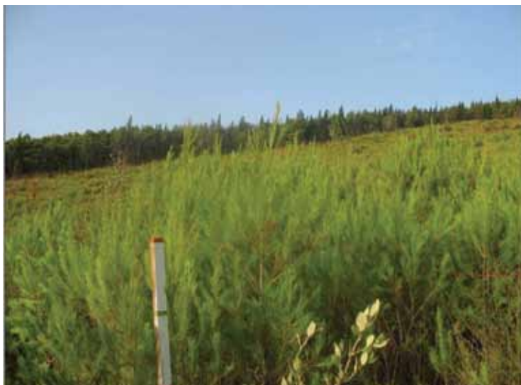
Slika 2. Pokusna ploha 1.