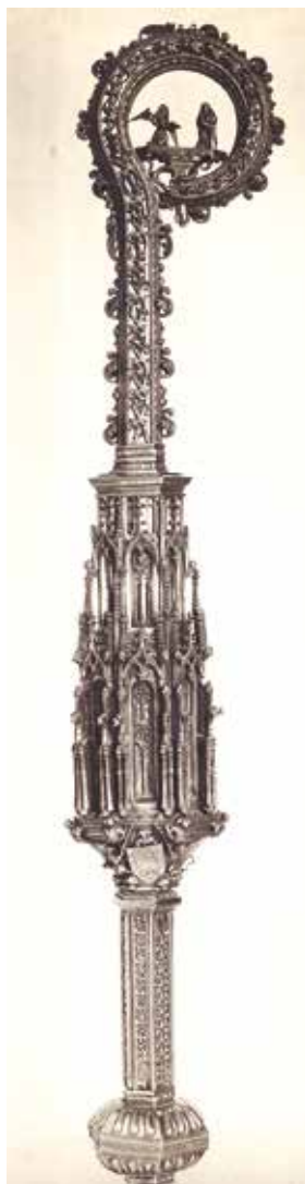
3 Riznica katedrale – biskupski štap od srebra koji je služio biskupu Luki. Rad južnonjemačke radionice s kraja 15. stoljeća. Fototeka Ministarstva kulture, UZKB. (foto: V. Tkalčić, 1912. god.; inv. br. 1088; neg. VIII-95)

Cathedral treasury – Bishop's silver cane used by Bishop Luke. Work of end 15 th century South German workshop. Photo archive of the Ministry of Culture, Directorate for the Protection Cultural Heritage (photo: V. Tkalčić, 1912; inventory number 1088; negative VIII-95)