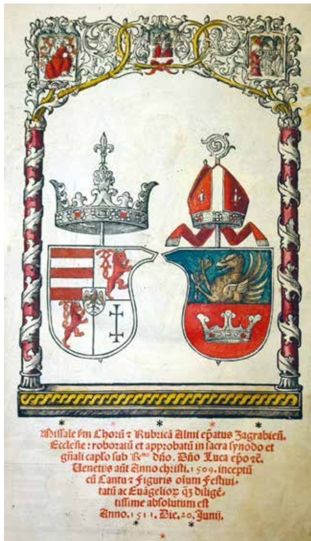
4 List s grbom biskupa Luke iz zagrebačkog misala, Missale Episcopatus Zagrabienensis , koloriran, Venetiis, 1511., list 6. Riznica zagrebačke katedrale, oznaka K8.

Cathedral treasury – Bishop's silver cane used by Bishop Luke. Work of end 15 th century South German workshop. Photo archive of the Ministry of Culture, Directorate for the Protection Cultural Heritage (photo: V. Tkalčić, 1912; inventory number 1088; negative VIII-95)