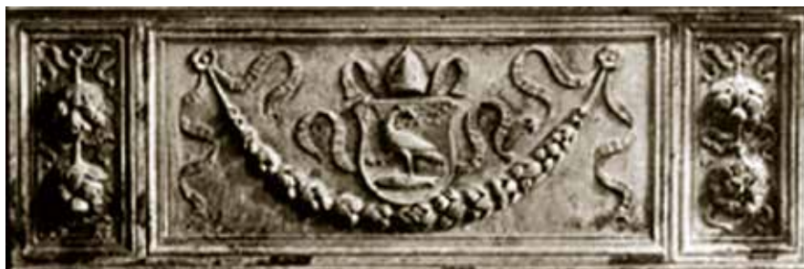
11 Detalj kustodije stare župne crkve u Pešti iz 1507. godine (Preuzeto iz: Pelc, Milan: Ugarske kiparske radionice i renesansa u sjevernoj Hrvatskoj, Radovi IPU 30, Zagreb, 2006.)

Detail of custody of old parish church in Pest dated 1507 (taken over from: Milan Pelc: „Hungarian sculpture workshops and the Renaissance in northern Croatia“, RIPU 30, Zagreb, 2006)