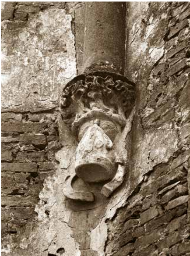
7 Detalj konzole polustupa gotičkog svoda u svetištu crkve sv. Ivana Krstitelja u Kloštar Ivaniću, stanje 1982. godine (Fotodokumentacija HRZ-a, foto: D. Miletić)

Detail of console of pilaster of Gothic arch in the sanctuary of the church of St. John the Baptist in Kloštar Ivanić, condition in 1982 (Photo documentation of the Croatian Restoration Institute, photo: D. Miletić)