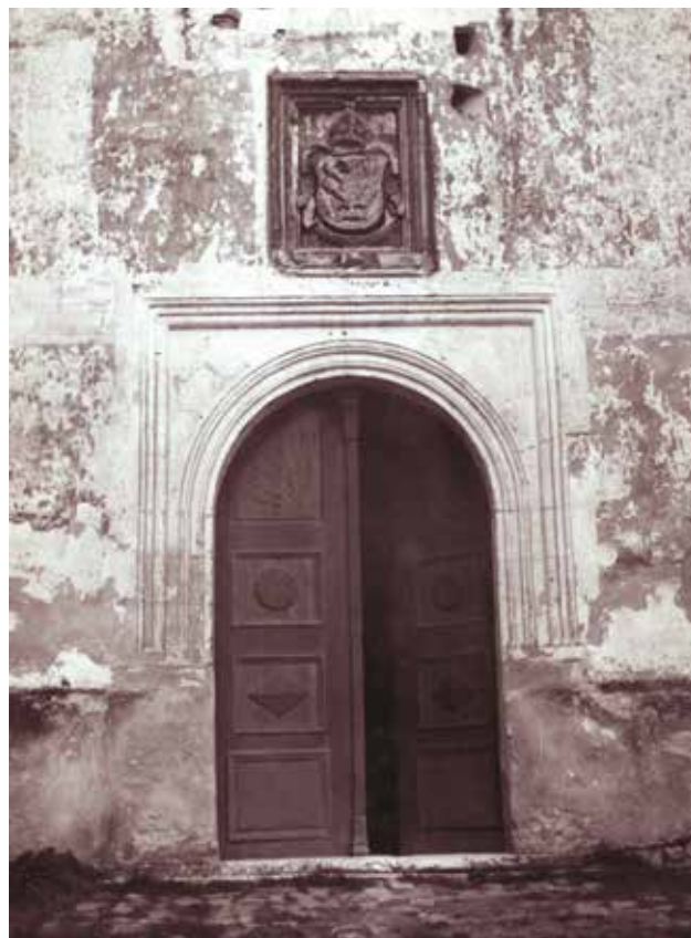
6 Franjevačka crkva Sv. Ivana Krstitelja – vanjština: glavni ulaz s grbom biskupa Luke.

Franciscan church of St. John the Baptist – exterior: main entrance with the coat of arms of Bishop Luke.