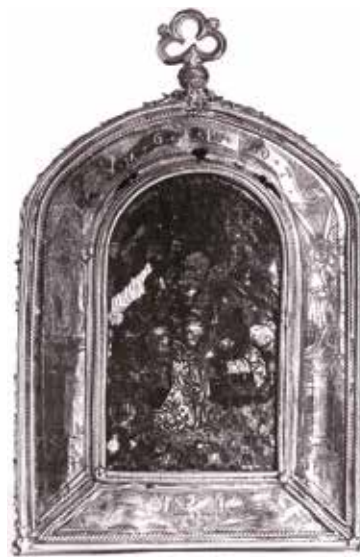
2 Riznica katedrale – pacifikal biskupa Luke. Na donjem dijelu okvira stražnje strane s prikazom smrti Bogorodice okružene apostolima nalaze se dva anđela s Lukinim grbom. (1913. god.; inv. br. 672; neg. VI-39.)

Coat of arms of Bishop Luke (taken from: B. Zmajčić: “Coats of arms of Zagreb bishops and archbishops”, Grbovi zagrebačkih biskupa i nadbiskupa ”, Anthology of the Zagreb diocese / Zbornik zagrebačke biskupije/ 1904-1944 , Zagreb, 1945)