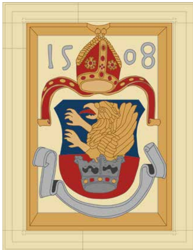
10 Rekonstrukcija izvornog obojenja grba (Dokumentacija HRZ-a, crtež: A. Šimičić)

Reconstruction of original colouring of the coat of arms (Documentation of the Croatian Restoration Institute, drawing: A. Šimičić)