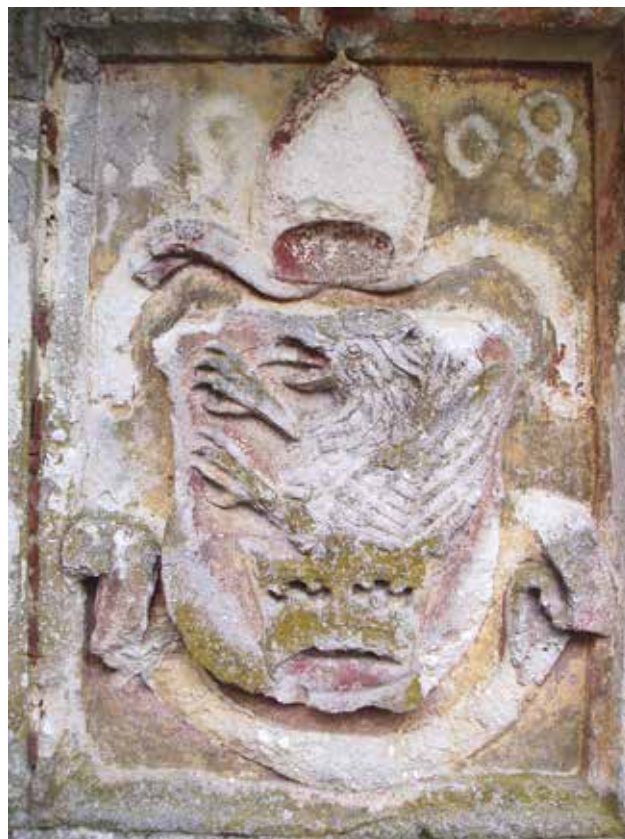
9 Grb biskupa Baratina, stanje 2005. godine

Grb biskupa Luke iz Kloštar Ivanića demontiran je 2005. godine početkom radova na obnovi glavnog pročelja