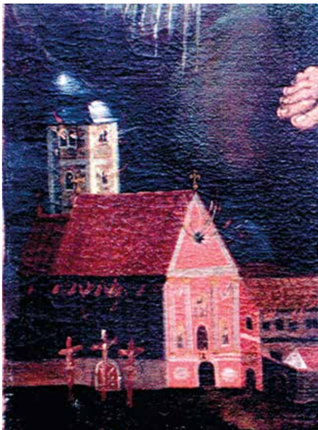
8 Detalj oltarne pale sv. Florijana iz crkve sv. Ivana Krstitelja u Kloštar Ivaniću (Izaija Gasser i pomoćnik, oko 1750. godine), s prikazom oslikanog glavnog pročelja. Nad ulaznim portalom nazire se i biskupski grb s zlatnožutim okvirom. Detail of the altarpiece of St. Florian from the church of St. John the Baptist in Kloštar Ivanić (Isaias Gasser and assistant, around 1750), showing the painted main facade. The Bishop's coat of arms with golden frame can be discerned above the entrance portal.

se za Boga u Kraljevini Slavoniji i u dijelovima Ugarske, Hrvatske i Štajerske, ovaj samostan u Ivaniću broji kao peti u Kraljevini Slavoniji i Zagrebačkoj biskupiji. Osnovan je i smješten dijelom među kršćanima katolicima, a dijelom, i to najvećim, među Vlasima, odnosno grčkim raskolnicima, s time da je nekoć bio u području turske vlasti. Zajedno s crkvom posvećen je i predan sv. Ivanu Krstitelju. Ovaj je samostan, prema tvrdnjama nekih, nekoć podignut, posjedovan i naseljen od redovnica iz Premonstratskog reda, a prema tvrdnjama drugih, radi se o ocima pustinjacima iz Reda sv. Augustina. Što je od toga bliže istini – ne zna se; jedino se iz znamenita urezanoga u kamen nad vratima crkve vidi kako je vjerojatnije da je pripadao muškarcima; ondje se, naime, nazire infula, odnosno mitra, iznad grifona, s oznakom godine 1508.“