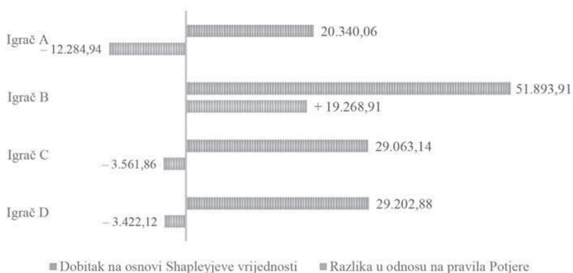
Grafikon 1: Alokacija dobitka na osnovi Shapleyjeve vrijednosti

Grafikon 1. prikazuje prijedlog alokacije osvojene novčane nagrade s obzirom na dobivenu Shapleyjevu vrijednost. Igraču A u skladu s pripadnom Shapleyjevom vrijednošću trebala bi pripasti svota od 20.340,06 kuna, a prema pravilima "Potjere" igraču A dodijeljen je iznos od 32.625,00 kuna. Proizašla je razlika negativna i apsolutno izraženo iznosi čak 12.284,94 kune.