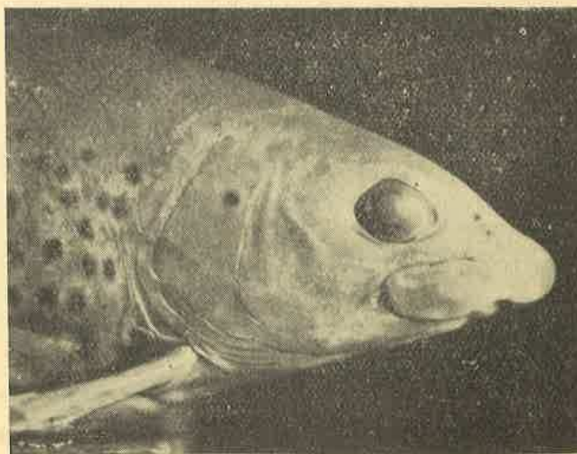
Glava mekousne iz Neretve

kod Splita, mekusna iz Neretve i pritoka te lipljen iz Zete (donjeg toka) u Crnoj Gori. U isti rod je ihtiolog Berg stavio i ohridsku belvicu iz Ohridskog jezera.