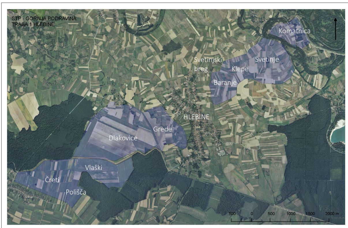
Sl. 1 Prikaz Trase 1 – HLEBINE (izradila: F. Sirovica).