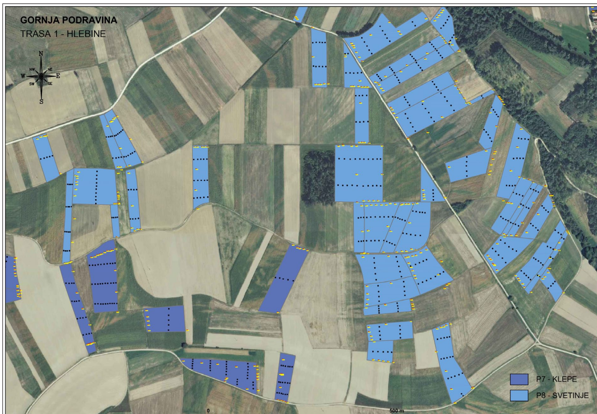
Sl. 3 Prikaz pregledanih lokacija na položajima Klepe i Svetinje (izradila: F. Sirovica).

Postupak je obuhvatio i intenzivniji pregled lokacija na kojima je utvrđena izrazitija gustoća površinskog materijala, pa je u takvim situacijama pregled izveden u razmacima od oko 3 metra i u vremenskom intervalu od 1 minute. Tijekom toga postupka u jednoj je liniji pregleda prikupljen sav prisutan materijal kako bi se omogućila što detaljnija analiza prisutnih ostataka i njihova što utemeljenija interpretacija. Osim bilježenja podataka o distribuciji materijala provedeno je zasebno dokumentiranje svih uočenih tvorevina (koncentracija keramike, promjena u boji i vrsti tla vidljivih na površini, tragova gorenja i sl.) čime