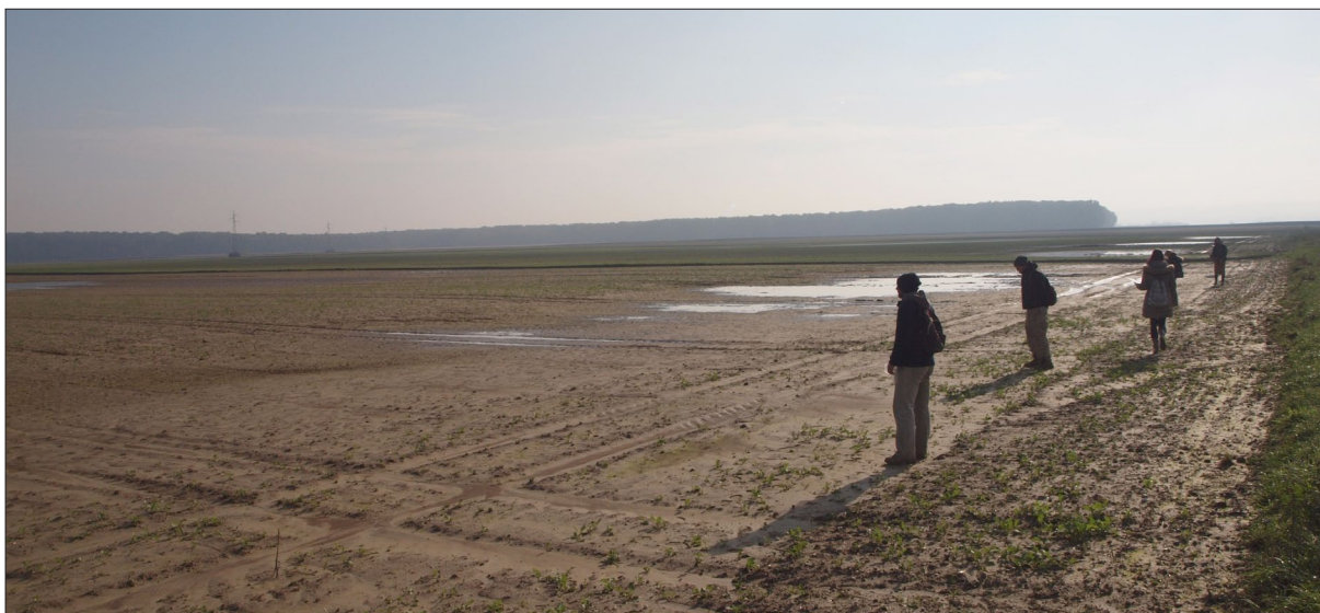
Sl. 2 Terenski pregled velikih parcela s devet sudionika raspoređenih na udaljenosti od 10 metara (T1-P4-L2) (snimila: F. Sirovica).

Fig. 2 Field survey of large land plots with 9 participants standing 10 meters apart (T1-P4-L2) (photo by: F. Sirovica).