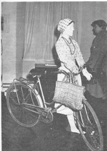
Detalj s izložbe Nošnje samoborskog kraja u Samoborskom muzeju, III. soba

žbe odmah jasno da će se narodne nošnja, odnosno odijevanje, pratiti kroz transformacije, koje donosi vrijeme, i kroz prilike, odnosno funkcije životnih sadržaja. Prva prostorija opremljena je tako da nas uvodi u svečane trenutke sela — vjenčanje, crkvena procesija i sahrana. Svečano prostiranjem stolom u kutu sobe ostvaren je ugođaj kućnih slavlja, dok su fotografijama scena na otvorenom dočarani vanjski sadržaji. Narodne su nošnje prikazane na lutkama, prebačene preko škrinja za spremanje nošnji i postavljene na zid uz fotografije prikladnih sadržaja. Rekonstrukcija