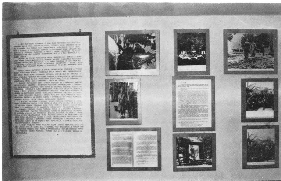
Detalj spomen-sobe Požeškom vojnom području u društvenoj prostoriji OO Kooperanata u Velikoj