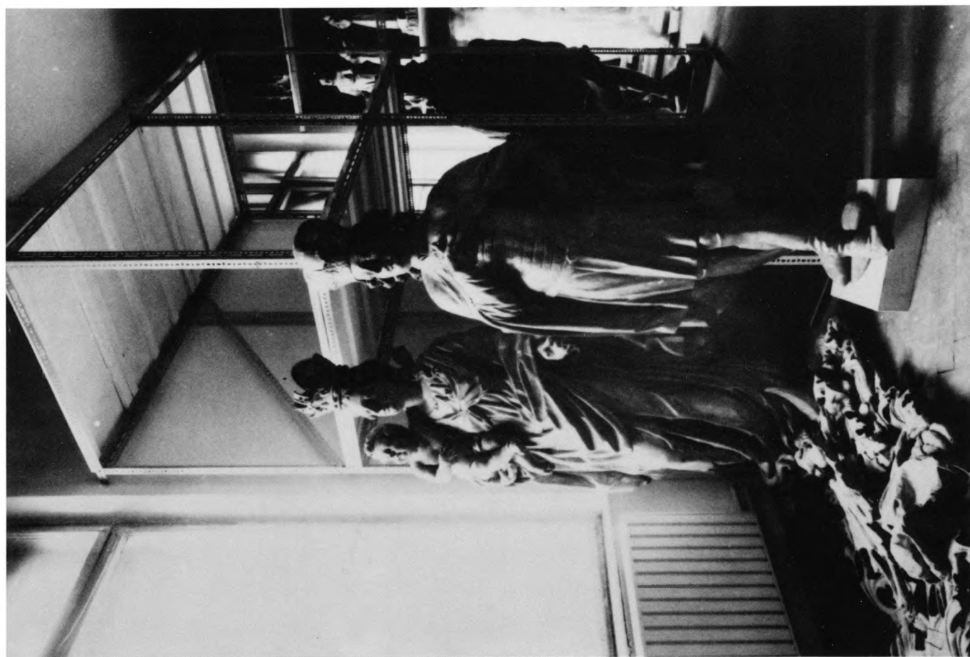
Muzej za umjetnost i obrt, Zagreb – depo za zbirku skulpture prije obnove