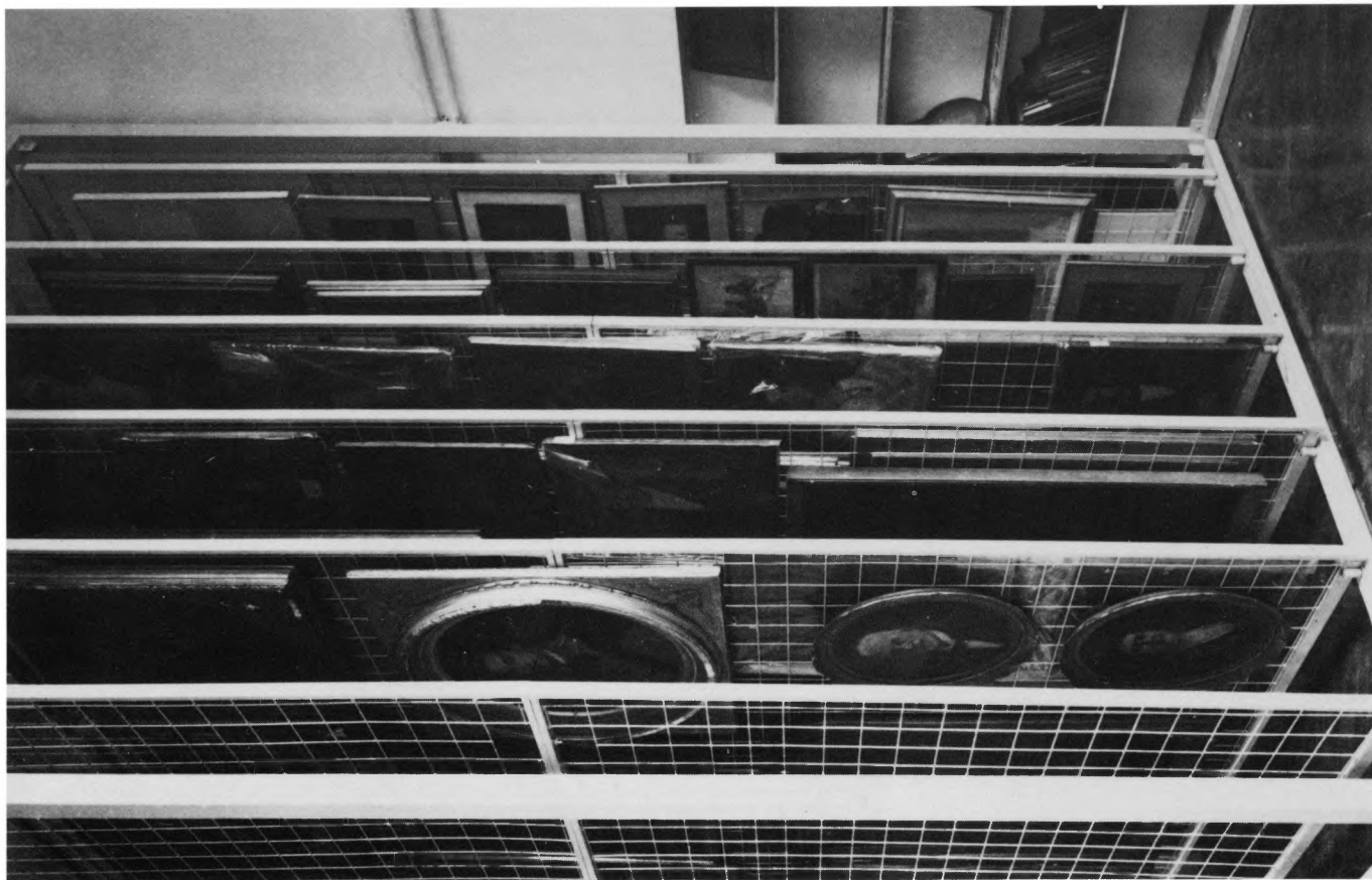
Muzej za umjetnost i obrt, Zagreb – obnovljen i uređen depo za zbirku slikarstva