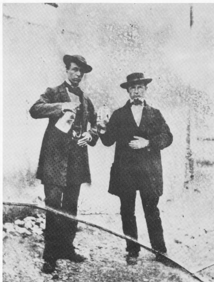
Ivan Kotar, Otkrivanje Prešernovog spomenika u Ljubljani, 1905, sa izložbe 150 let fotografije na Slovenskem, Mestna galerija, Ljubljana