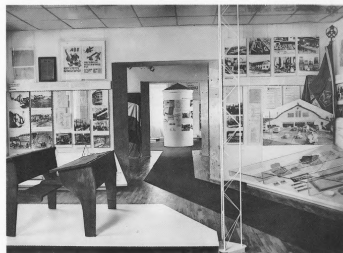
Muzej revolucije, Celje – detalj postava I razdoblja (1945–1950); iz fototeke Muzeja revolucije

Razdoblje 1945–1950. predstavljeno je sljedećim temama: zadnji dani rata, obnova i društveno politički život nakon oslobođenja, osnivanje mreže osnovnog i srednjeg školstva, nestašica stanova i opskrba – dva osnovna problema grada, polaganje temelja socijalističke privrede i prva petoljetka, crveni kutić, procvat narodnog prosvjetiteljstva i fiskulture u slobodi.