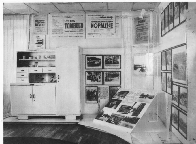
Muzej revolucije, Celje – detalj postava II razdoblja (1950–1963)