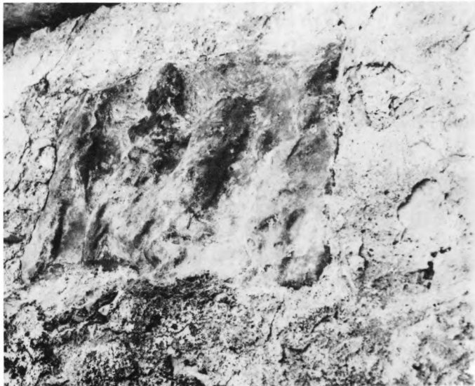
Reljef Mitre uzidan pod krov staje u selu Umljanovići. Vlasnik traži basnoslovnu svotu za otkup reljefa