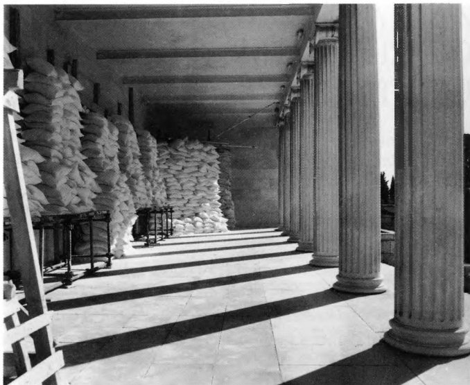
Mjere zaštite u Galeriji Meštrović, Split – prozori izložbenih dvorana prekriveni su vrećama šljunka, kao i kameni reljefi u samom trijemu

Uljene slike, crteže i najvredniju arhivsku građu također je bilo lako zaštititi jer ne zapremaju velik prostor. Crteži se i inače nalaze u metalnim ormarima s ladicama, a nabavom još dva takva ormara moglo se dobro zaštititi i slike i arhiv. Ti metalni ormari smješteni su pored nosivih zidova u suhu prostoriju u najnižem dijelu kuće, koja je ujedno željeznim rešetkama zaštićena od provala.