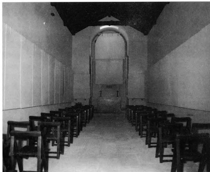
Mjere zaštite u Kapeli sv. Križa na Crikvinima – reljefi i raspelo u drvu zaštićeni su šperpločama premazanim sredstvima za zaštitu od požara

Sve umjetnine su inventirane i fotografirane, što je također način zaštite. Prijepisi inventarnih knjiga i fotografije umjetnina dislocirani su na još dva mjesta od kojih je jedno izvan Europe. Također su zapisane i sve promjene u smještaju umjetnina, a zapisi dislocirani.