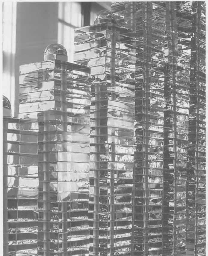
Dio staklene balustrade u prostoru Zbirke stakla

For the Victoria and Albert Museum, which was established in 1852 and is probably the largest and the richest museum of the applied arts in the world, every departure from tradition must be bordering on revolution. However, it seems that the Museum policy takes a rather pragmatic course in the inevitable modernization: about once a year it opens the one redesigned permanent display, thus avoiding the disruption of its usual activities. Last year the Museum opened the two renovated permanent displays: the exposition of the collection of