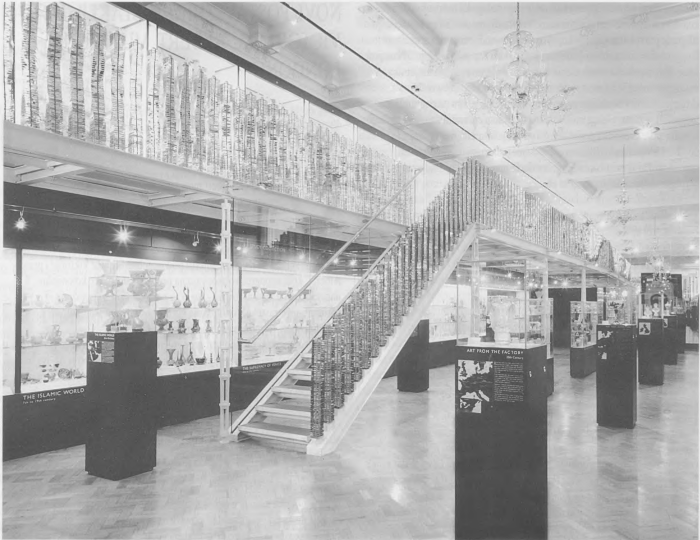
Dio postava Zbirke stakla u Victoria & Albert muzeju u Londonu

Ova potonja naišla je na dosta kontroverzne recepcije te zaslužuje nešto širi osvrt.