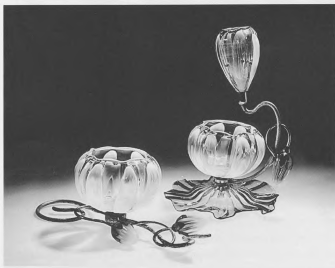
Predmet izložen u sklopu novog stalnog postava Zbirke stakla

Za muzej koji je osnovan 1852. godine i neprekidno radi do danas, svaka promjena i odklon od tradicije predstavlja gotovo revolucionarni čin. No, čini se da je politika muzeja u odnosu na nužnu modernizaciju stalnog postava zauzela dosta pragmatičan stav: obnavljaju se samo određene izložbene cjeline, tako da se ne prekidaju ustaljene aktivnosti i djelatnosti muzeja. Otprilike jednom godišnje otvara se jedan obnovljeni segment, tematski postav. Prošle je godine Victoria & Albert Museum realizirao dva takva postava, izložbe željeza i stakla.