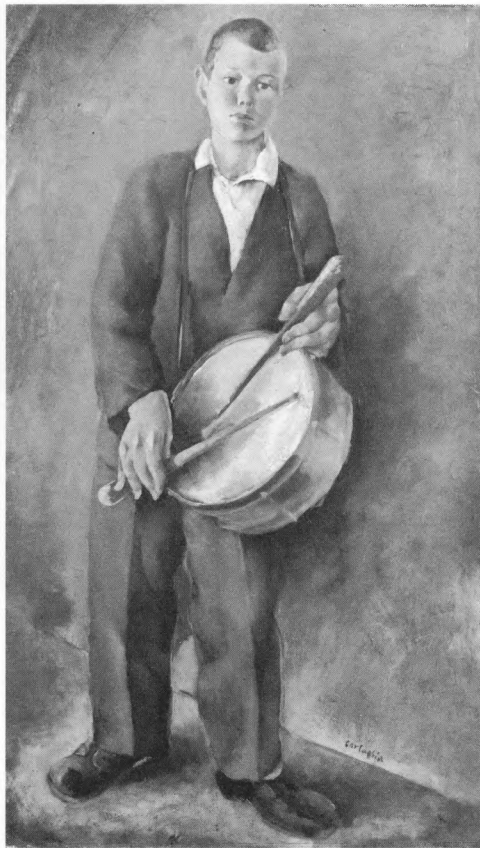
Marino Tartaglia: Mali bubnjar, 1926., ulje na platnu (136x79cm)

Devedesetih godina, tj. od 1995. kada je održana I. međunarodna bijenalna izložba "Mediterranski susreti", za fundus se otkupljuju djela za međunarodnu zbirku. Ova zbirka uz otkupe povećana je i za nekoliko donacija i ima 10-ak umjetnina autora iz Izraela, Egipta, Italije i