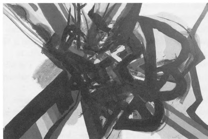
Edo Murtić: Razbijeni putokazi, 1972., ulje na platnu (147x220 cm)

Inicijativa za osnivanje Galerije postojala je i u međuratnom periodu, kada se intenzivirala izložbena djelatnost, a nije postojao adekvatni prostor u kojem bi umjetnici mogli kontinuirano prezentirati svoje radove. Do tada su izložbeni prostori bili izlozi dućana na Stradunu - ljekarna Šarić, zlatarna Bibica, Čitaonica, dućan Stjepana Bravačića, dućan M. Mitrovića, općinska kavana i općinska dvorana, 1 zatim Sponza, Dvorana Ženske narodne udruge, salon Weiss, Oficirski dom, dućan Duje Martinija, dvorana kavane "Dubravka", a uoči II. svjetskog rata i Muzej Rupa. 2 Kosta Strajnić, koji je u Dubrovnik došao 1928. godine, odazvavši se pozivu za popunjavanje upražnjenog mjesta konzervatora starina, 1929. godine u časopisu "Dubrovnik" piše o potrebi osnivanja galerije suvremene umjetnosti. Galeriju je zamišljao kao izložbeni prostor u kojem bi se izlagala djela suvremenih umjetnika otkupljena od umjetnika ili, bude li to financijski neizvedivo, posuđena od umjetnika ili privatnih kolekcionara. 3