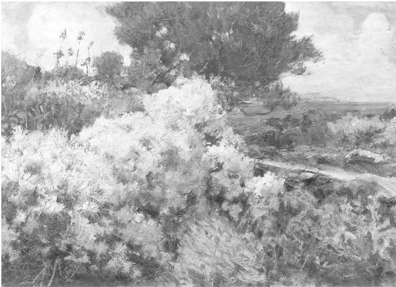
Mato Celestin Medović: Pelješki krajolik, 1914.-1918., ulje na platnu (26x35,5cm)

a ovo, na žalost, nisu jedini slučajevi krađa umjetnina u Dubrovniku i gubljenja njihova traga.