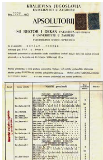
Slika 3. Prva stranica apsolutorija Zdenka Križana.

U listopadu 1944. godine docent Križan imenovan je odlukom Poglavnika Nezavisne Države Hrvatske izvanrednim sveučilišnim profesorom anatomije, a u veljači 1945. godine redovnim profesorom pri Katedri za anatomiju Medicinskog fakulteta u Sarajevu, Hrvatskog Sveučilišta u Zagrebu [4,5]. Ondje je vodio nastavu iz anatomije u zimskom semestru akademske godine 1944./45., odnosno do oslobođenja Sarajeva 6. travnja 1945. kada je prestala nastava na Medicinskom fakultetu u Sarajevu. Akademsko napredovanje do redovnog sveučilišnog profesora u razdoblju od travnja 1944. do veljače 1945., uz činjenicu da je prvi znanstveni rad objavio 1945. godine, pokazuju prirodu motiva