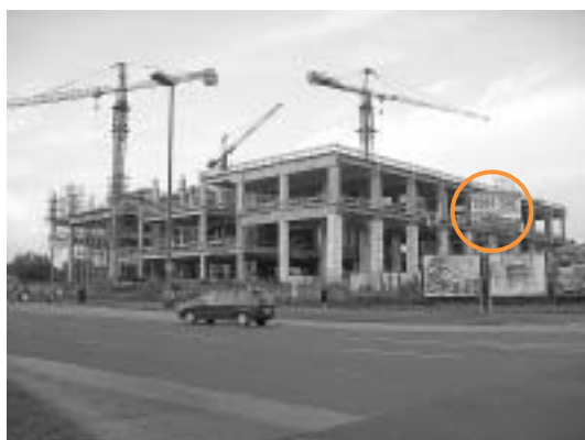
sl. 6., 7. Stara i nova zgrada Muzeja suvremene umjetnosti u Zagrebu - načini oglašavanja događanja i najava izgradnje novoga muzeja.

liku između sponzorstva i donacija, a drugi smo dan shvatili da smo na početku dugoga, vrlo dugog putovanja kojemu je Seminar o sponzorstvu u muzejima , što ga je organizirao Muzej suvremene umjetnosti 17. i 18. listopada 2005. možda tek druga stanica, bez obzira na velike promjene koje su se u međuvremenu dogodile.