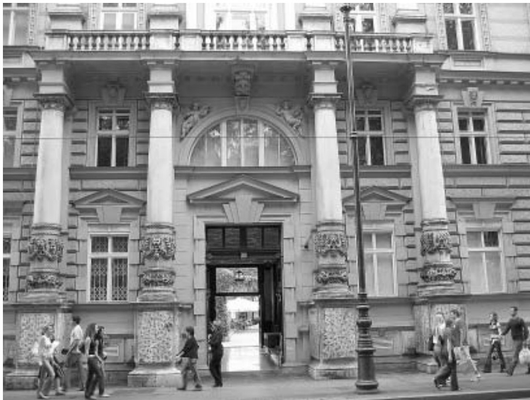
sl. 10. Arheološki muzej u Zagrebu primjer je muzeja koji vrlo diskretno i rijetko intervenira najavom događanja na fasadi i nikada ne ističe sponzorska oglašavanja

koristi, postalo teško biti jednim muzejskim opsluživačem bogatoga i vjerojatno zahtjevnog sponzora.