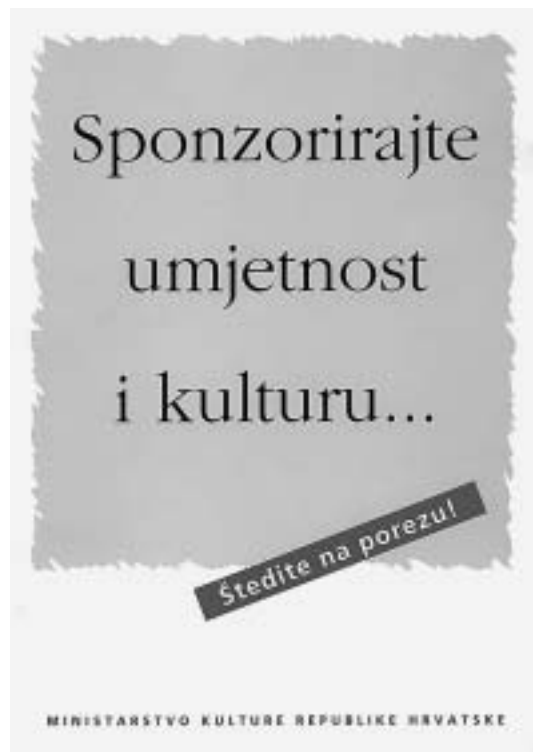
sl. 1.-4. Plakati Ministarstva kulture RH u povodu donošenja Zakona o pravima samostalnih umjetnika i poticanju kulturnog i umjetničkog stvaralaštva (NN 43/96), svibnja 1996.

institucijama. Taj se muzej u ovom pretraživanju ističe većim brojem nalaza nego svi ostali muzeji zajedno.