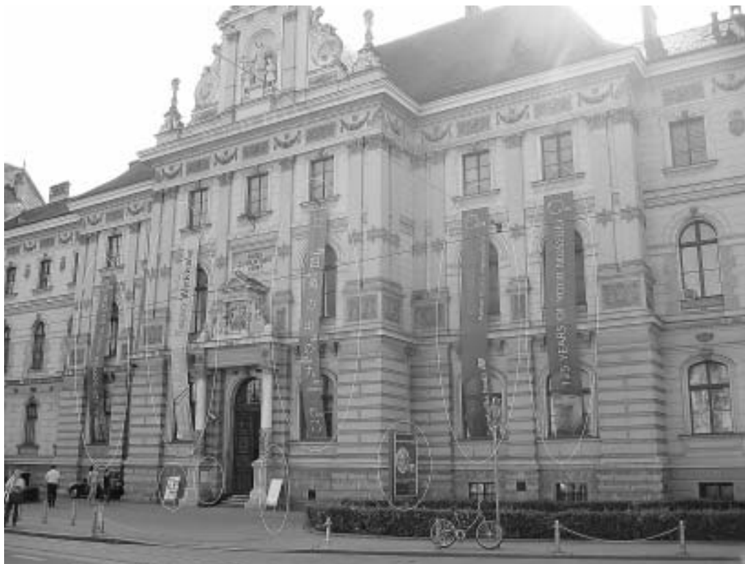
sl. 8., 9. Muzej za umjetnost i obrt u Zagrebu i Zagrebačka banka godinama njeguju uspješan partnerski odnos