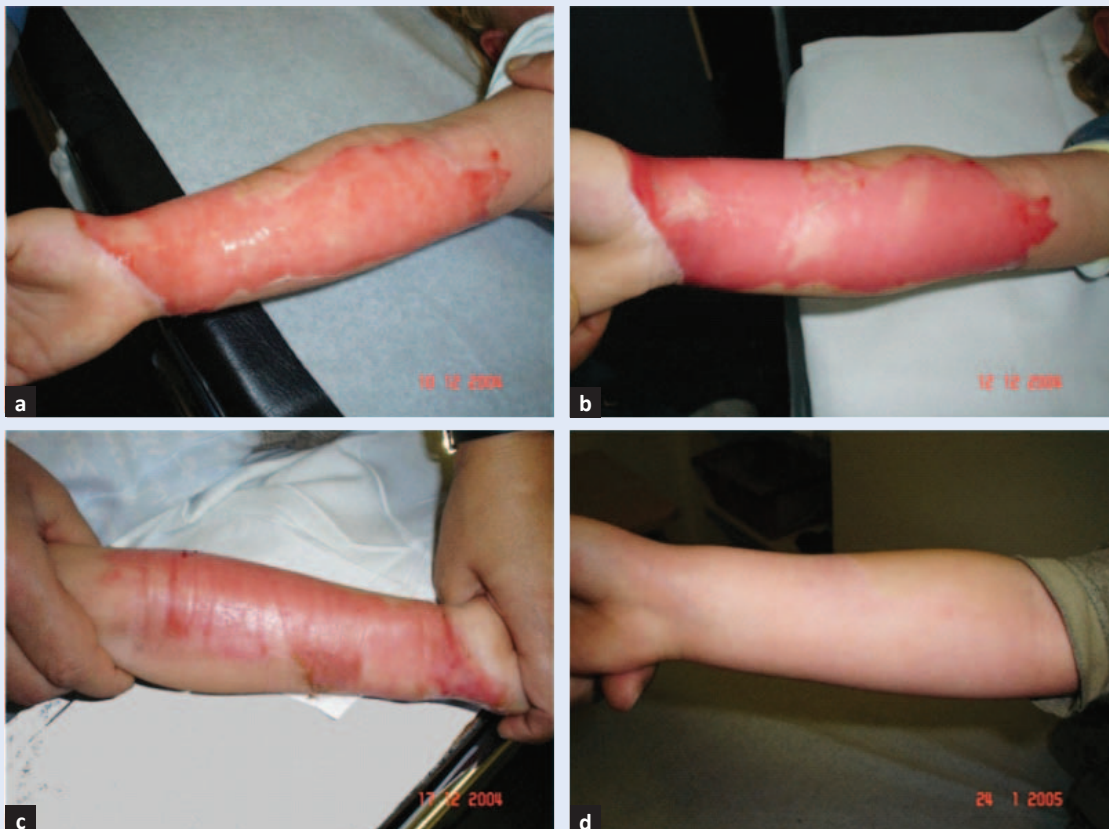
Slika 1. Opekline kože podlaktice IIA° s oštećenjem epidermisa i površnog dermisa prikazana tijekom liječenja sve do potpunog zacjeljenja: a) 2.; b) 4.; c) 9. dana i d) 6 tjedana nakon ozljede.

Osim procjene dubine (površne i duboke) važna je i procjena površine opekline. Brza procjena površine računa se "pravilom dlana" koji predstavlja 1 % ukupne površine tijela. Berkowljeva ili Lund-Brodwderova shema su preciznije, uzimaju u obzir dijelove tijela i godine starosti. Procjenom navedenih parametara opekline se kategoriziraju u lake, umjerene i teške.