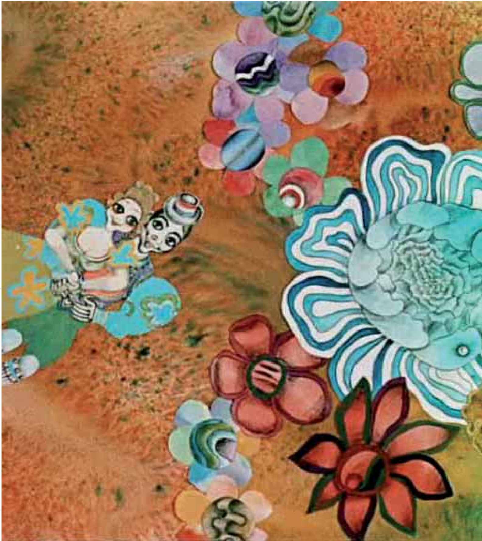
Andrija Muntjaković: Bourekov Bećarac – animirani film / Bourek's Bećarac – an Animated Film