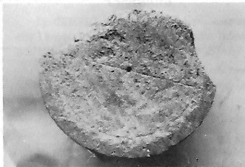
Sl. 3. Baza kapitela