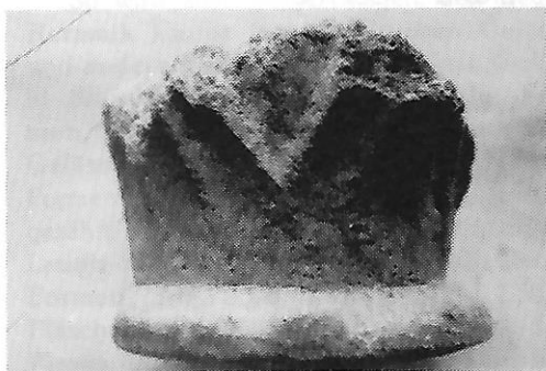
Sl. 2. Kapitel stupa