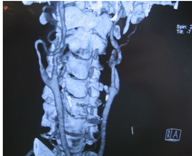
Sl. 1. Prikaz višeslojne kompjuterizirane tomografije (bolesnica opisana pod br. 1). Bilateralna zavojitost, uz prateće presavinuće desne strane

2) Bolesnica M.I. u dobi od 64 godine imala je simptomatsku subtotalnu stenozu lijeve ACI, uz popratnu dvostruku zavojitost ACI. Desna ACI pokazivala je presavinuće na proksimalnom segmentu, bez aterosklerotskih lezija. Što se tiče rizičnih čimbenika, bolesnica je pušila 20 cigareta/dan, bila je kardiopat, s hiperlipidemijom i šećernom bolešću, a preboljela je ishemijski moždani udar (IMU) sa zaostalom diskretnom hemiparezom desne strane tijela. Nakon urađene prijeoperacijske obrade pristupilo se kirurškom liječenju. Pri eksploraciji je nađena zavojitost ACI koja je uključivala stenozirani početni segment lijeve ACI, a zanimljivo je da je zavojitost formirana u obliku dvostruke petlje, koja je iznosila pri izravanjanju karotidne arterije gotovo 10 cm. Reseciran je produženi dio zajedno sa stenoziranom ACI, te je učinjena reanastomoza ACI i zajedničke karotidne arterije ACC. ACC je bila pošteđena aterosklerotskih lezija, osim nešto zadebljale intime, ali bez vidljivih aterosklerotskih plakova. Postoperacijski je učinjena transkranijaska doplerska sonografija, te ultrazvučni pregled oftalmičnih arterija koji su bili uredni, kao i kontrolni ultrazvučni pregled operirane karotidne arterije sedmog postoperacijskog dana. U postoperacijskom tijeku bolesnica je bila bez neuroloških ispada, a prvih šest mjeseci praćenja pokazalo je uredan postoperacijski nalaz.