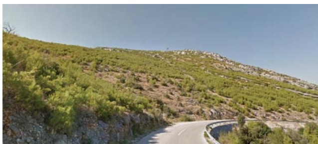
Slika 8. Obnova šume alepskog bora na brdu Jelinjak nekoliko godina nakon požara.

Iako je u odnosu na gole kamenjare pošumljavanje alepskim borom pozitivno u smislu povećanja vegetacijskog pokrova, njegov negativan učinak na ostale autohtone vrste je u izravnoj suprotnosti s jednim od ciljeva okolišne politike Europske unije, koja se zalaže za očuvanje bioraznolikosti medi-