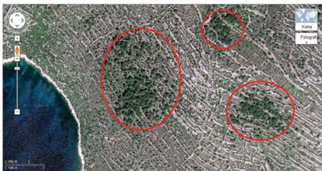
Slika 5. Satelitski snimak jugoistočnog dijela otoka Zmajana, primjer pejzaža u kategoriji većih skupina stabala alepskog bora . (Izvor: Google Earth).

Figure 4. Vegetation along the local road north of Vrpolje, example of landscape in the category of larger clusters of Aleppo pine trees.