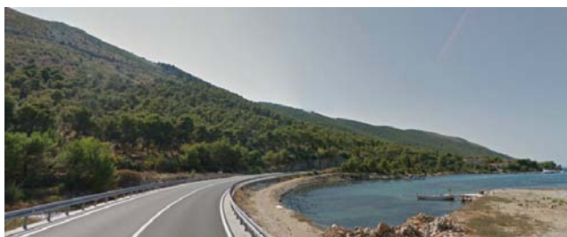
Slika 3. Brdo Jelinjak kod Grebaštice, primjer pejzaža u kategoriji potpune dominacije alepskog bora .

Figure 3. Jelinjak hill near Grebaštica, example of landscape category of Aleppo pine dominance.