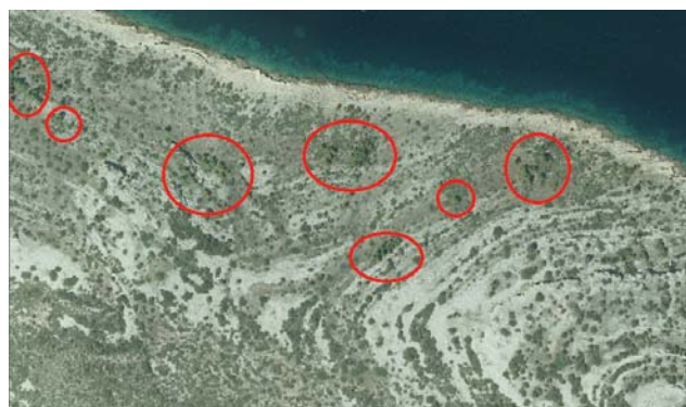
Slika 6. Satelitski snimak jugoistočnog dijela otoka Žirja, primjer pejzaža u kategoriji sporadične pojave stabala alepskog bora.

(Sl. 6). To su prostori gdje je alepski bor bio značajnije prisutan, ali je u velikoj mjeri iščeznuo zbog požara, prostori prekriveni gustom makijom u kojoj alepski bor uspijeva samo na otvorenijim dijelovima ili prostori na koje se alepski bor tek polagano širi. Najveće su takve površine u zaleđu Jadravca i Grebaštice kojega požari pustoše u intervalima od svega nekoliko godina, široj okolici Jadrje, koja je prema CO-RINE Land Cover bazi podataka opisana kao područje pašnjaka, te predjelu od Draga preko Pirovca do šuma u zaleđu Vodica. Ova kategorija zauzima 33 % površine istraživanog prostora, odnosno 1610 ha, te predstavlja zonu potencijalnog znatnijeg širenja alepskog bora u budućnosti.