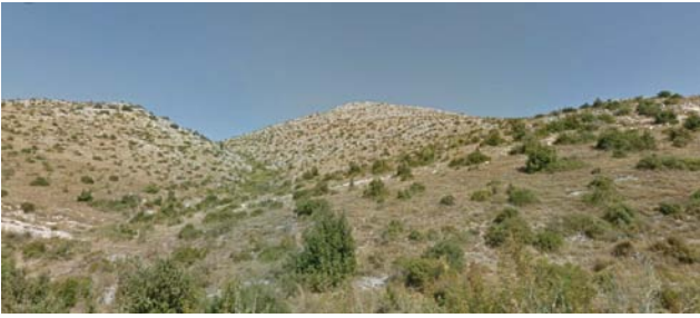
Slika 7. Kamenjar iznad naselja Donje Polje, primjer pejzaža u kategoriji nema alepskog bora .

Figure 7. Bare karst near settlement Donje Polje, example of landscape in the category of no Aleppo pine.