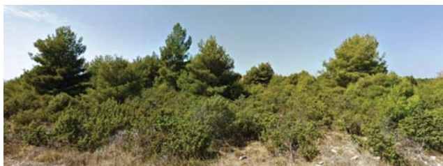
Slika 4. Pogled na vegetaciju uz lokalnu cestu sjeverno od Vrpolja, primjer pejzaža u kategoriji većih skupina stabala alepskog bora .

Sporadična pojava stabala alepskog bora treća je kategorija koja obuhvaća prostore u kojima se alepski bor pojavljuje u manjim grupama stabala i pojedinačno, na međusobnoj udaljenosti od nekoliko desetaka metara, a u pejzažu najčešće vizualno prevladava gusta makija ili rjeđe garig i kamenjar