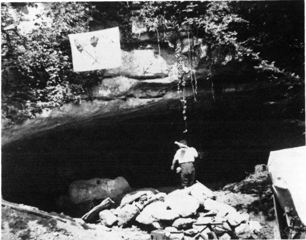
Slika 1. – Ulaz u Vindiju, istraživanja 1947. g.

»Razdragan ljepotom spilje i njene romantične okolice, sjedio sam nasuprot njenom golemom ulazu i slušao šum potoka koji je iz doline dopirao do mene, dok su mi se glavom istodobno vrzle razne misli. Uspinjući se iz doline do ulaza spilje našao sam u vododerini puteljka nekoliko krhotina zemljanih posuda koje su po svemu odavale da potječu s posuda prethistorijskog čovjeka. Nisam naprosto htio sebi vjerovati da je to moguće. Zar da se ispunio davni moj san i ja stojim pred pravim pravcatim zakloništem prethistorijskog čovjeka.«