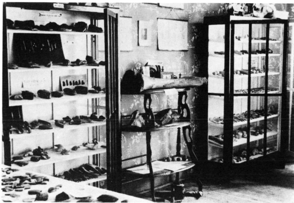
Slika 3. – Vukovićeve privatna zbirka, 1934. g.