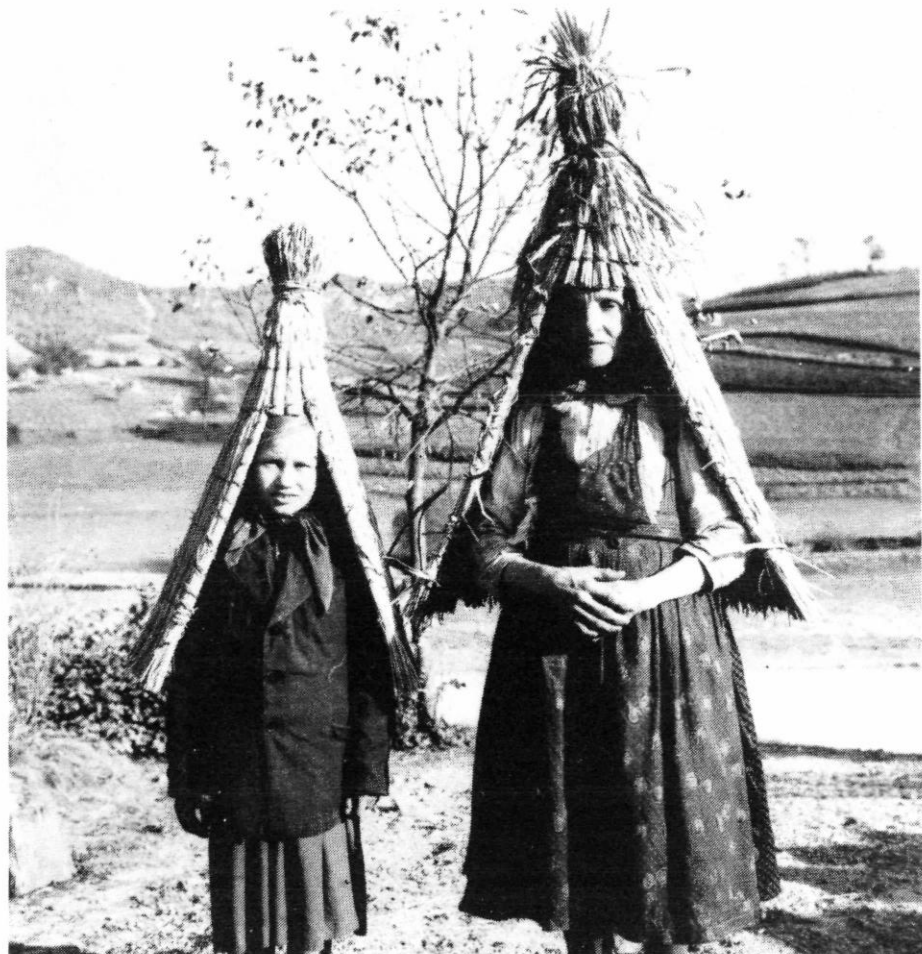
Slika 7. – Plašč

Snimio S. Vuković u Donjoj Višnjici 1959. g. (?) (dokumentacija AO GMV)