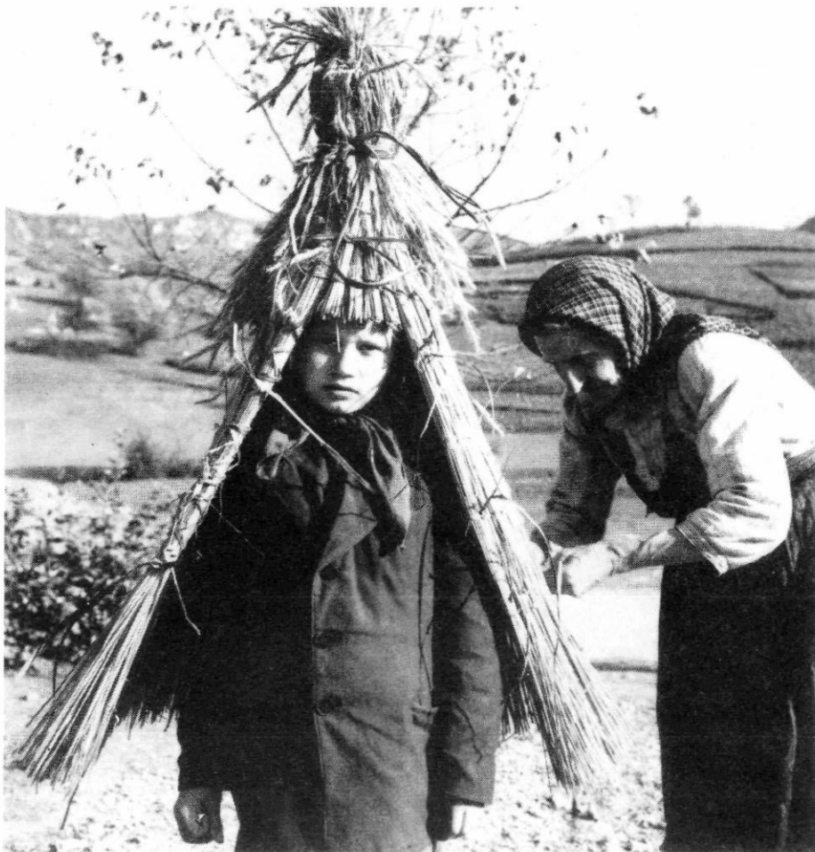
Slika 6. – Izrada plašča, Donja Višnjica

Snimio S. Vuković 1959. g. (?) (dokumentacija AO GMV)