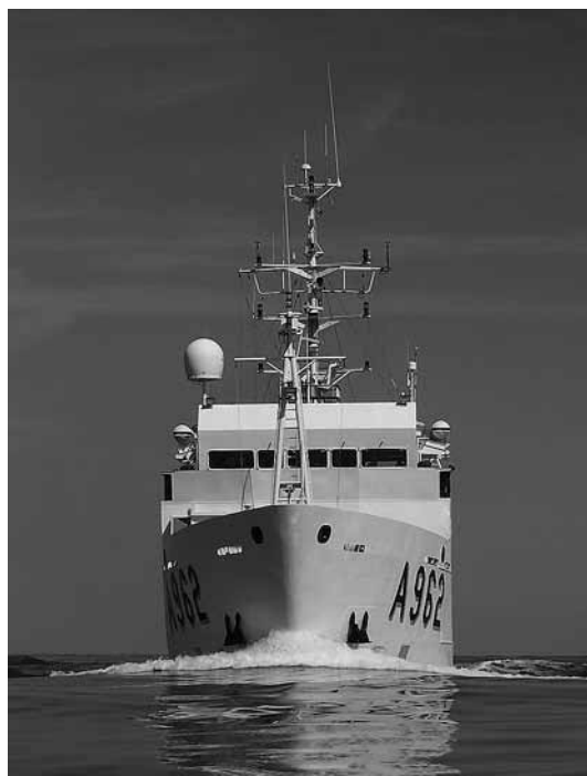
sl.1. Oceanografski brod Belgica , Institut royal des Sciences Naturelles de Belgique.

WIM DEVOS □ Ured federalne znanstvene politike, Bruxelles, Belgija