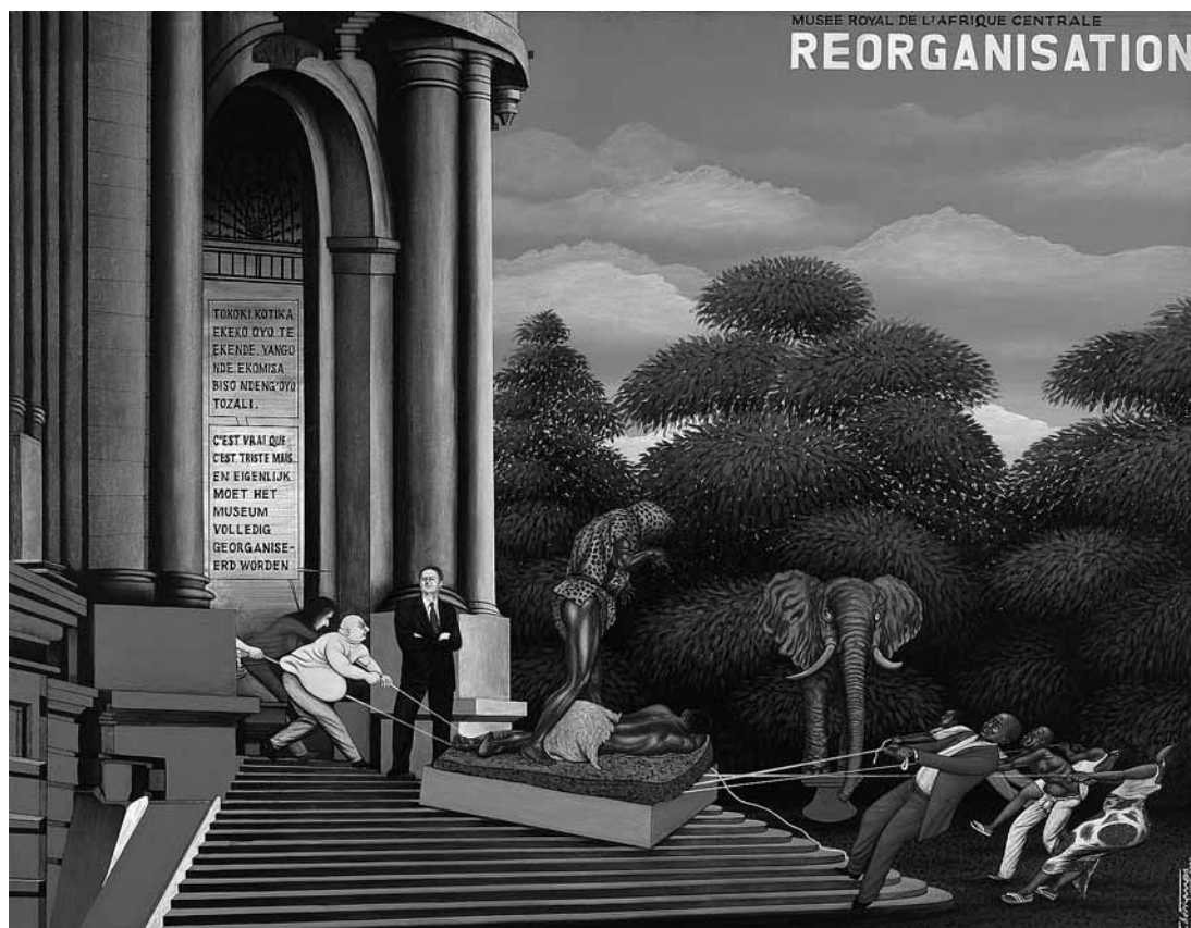
sl.13. Chéri Samba, Reorganisation, 2002. 104x134 cm ulje na platnu

Godine 2008. promijenjen je način ostvarivanja karijere znanstvenika u federalnim muzejima te je njihov profesionalni put prilagođen stvarnosti rada u muzejima. Znanstvenici u federalnim muzejima i dalje mogu izabrati zvanje na području fundamentalnih istraživanja, no mogu izabrati i karijeru znanstvenika na području primijenjenih znanosti. Tim se novim statusom omogućuje da vrhunski intelektualci prioritet daju istraživanjima i aktivnostima nabave, očuvanja i popisivanja predmeta baštine, pripremi i osmišljavanju stalnih i privremenih izložbi te aktivnostima popularizacije znanosti poput radionica, grupnih posjeta, internetskih stranica i svih oblika komunikacije. To uvelike pridonosi velikoj kvaliteti muzejskih usluga.