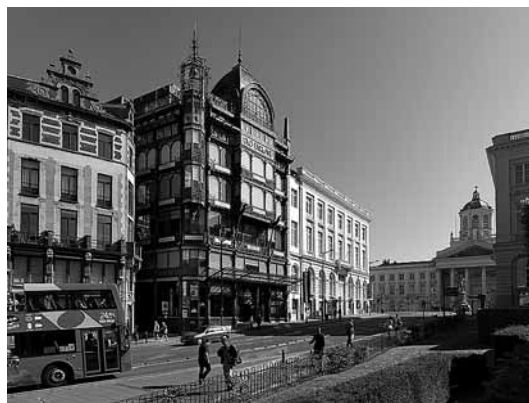
sl.9. Muzej glazbenih instrumenata, Musées royaux d'Art et d'Histoire.

(Musée royal de l'Afrique centrale, www.africamuseum.be ) u nadležnosti su Javne službe Federalna znanstvena politika.