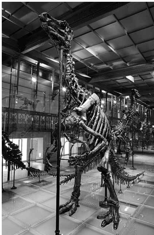
sl.10. Cryolophosaurus , Institut royal des Sciences naturelles de Belgique.

Od jeseni 2012. zbirke art nouveau (i, općenito, zbirke stvarane između 1860. i 1920. g.) bit će izložene u obnovljenim dvoranama koje će nositi naziv Muzej kraja stoljeća ( Fin de siècle Museum ). Budući da su dvorane s izloženim djelima moderne i suvremene umjetnosti zatvorene zbog hitnih radova obnove i održavanja, trenutačno se razmatra mogućnost otvaranja novog muzeja moderne umjetnosti u Bruxellesu. Novi bi muzej trebao biti plod suradnje federalne Vlade, nadležnih federalnih jedinica i grada Bruxellesa. No Kraljevski su