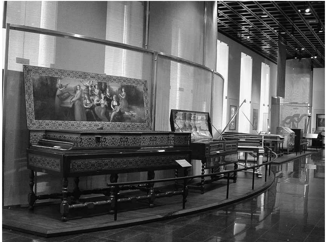
sl.8. Muzej glazbenih instrumenata, unutrašnjost muzeja, Musées royaux d'Art et d'Histoire.