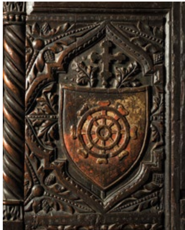
5. Grb nadbiskupa Blaža Molina.

The coat of arms of Archbishop Luca of Fermo