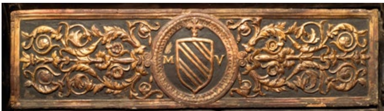
8. Grb nadbiskupa Maffeja Valaressa na kneževu sjedalu. The coat of arms of Archbishop Maffeo Vallaresso on the Count's seat

Dvadeset ćelija donjeg reda klupa izvedeno je istovjetno, uz manja odstupanja. Navedena odstupanja prisutna su u gornjem dijelu, u izradi kaseti s rombovima, gdje varira njihova veličina. S druge strane, donji dio naslona, na kojem se izmjenjuju dvije vrste dekorativnog programa, vrlo je ujednačen u izvedbi. Za razliku od naslona gornjeg dijela na kojima su pričvršćeni dekorativni elementi, osnovu dekoracije naslona donjeg dijela obaju krila čine tanki profili unutar kojih su prostori ažurirani motivima kružnica, suza, trolista ili shematiziranih gotičkih monofora. Ponavljaju se elementi kojima su dekorirani nasloni nadbiskupova i kneževa sjedala, pa ako se prihvati teza da su nadbiskupovo i kneževo sjedalo s ažuriranim naslonima za leđa izrađeni u kasnijoj fazi, u vrijeme nadbiskupa Lovre Veniera, može se pretpostaviti da su i donji redovi dekorirani u istom razdoblju. Ista teza može se primijeniti i na dekoraciju kosih daščica gornjih redova klupa. 17