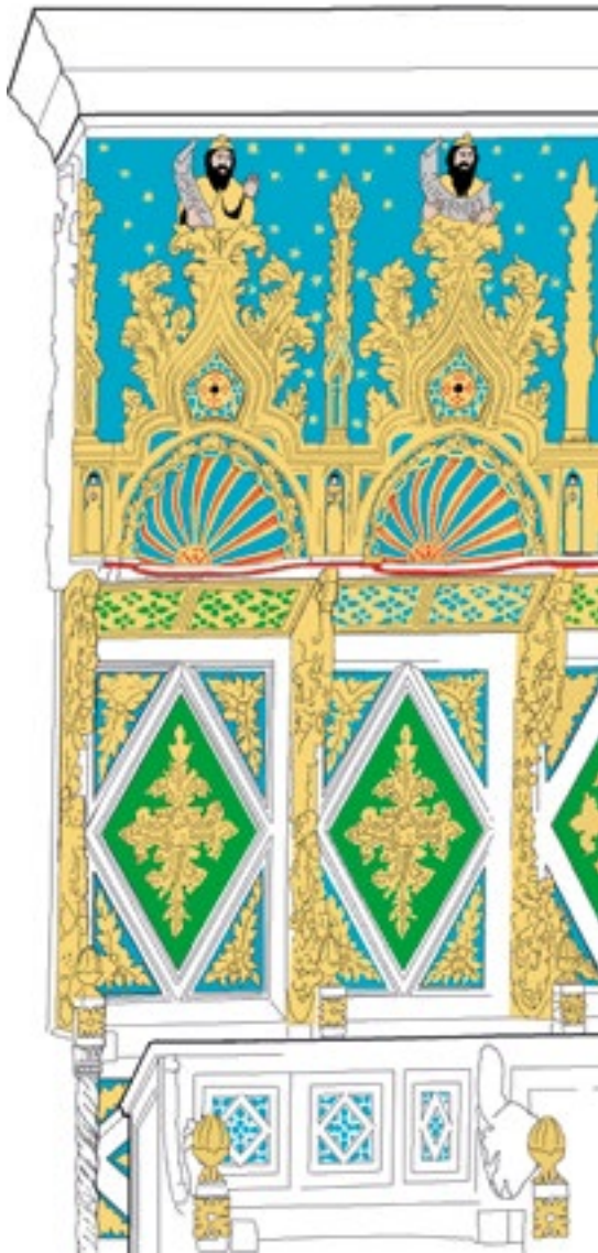
14. Rekonstrukcije mogućeg izgleda polikromije (crtež izradila K. Škarić).

Reconstruction of the possible appearance of the polychromy (drawing by K. Škarić)