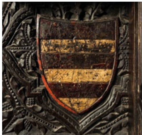
6. Grb nadbiskupa Lovre Veniera.

Za postizanje maksimalne učinkovitosti u drvorezbarskim radionicama organizirana je svojevrсна podjela poslova. U tom smislu može se pretpostaviti da je dekoracija rađena u etapama i grupama, a ne pojedinačno za svaku ćeliju. Drugim riječima, može se pretpostaviti da su drvorezbar i njegovi pomoćnici odjednom izradili sve