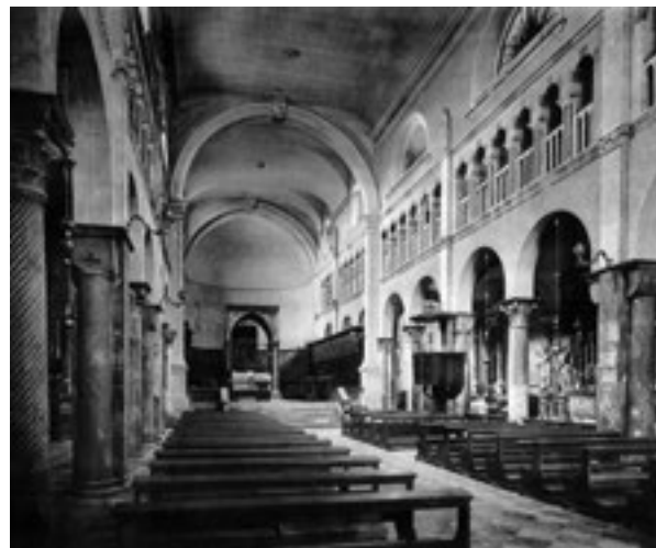
19. Crkva prije rekonstrukcije (Ć. M. IVEKOVIĆ, Građevinski i umjetnički spomenici Dalmacije I. Zadar, Beč, 1928., sl 6). The church prior to the reconstruction (from: Ć. M. IVEKOVIĆ, Građevinski i umjetnički spomenici Dalmacije I, Zadar, Beč, 1928, image 6)

Marcocchijevoj obnovi možemo pripisati brojne popravke rezbarije, osobito zamjene oštećenih vrhova lišća