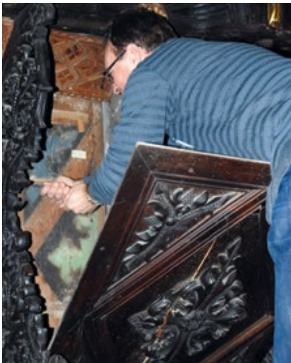
15. Demontiranje ploče uz otklesani pilastar. Dismantling the panel next to the chiseled-off pilaster