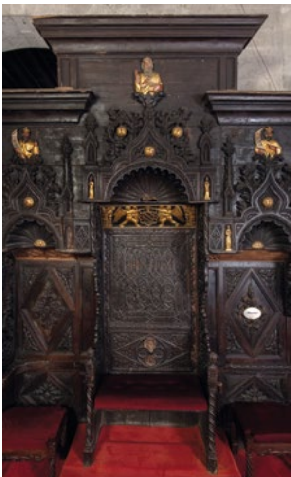
10. Nadbiskupovo sjedalo. The Archbishop's seat

Jednostavnije su, ali također ukrašene, i poledine korskih klupa. Svako sjedalo sa stražnje strane zatvaraju po dva okomito postavljena niza rombova koji su međusobno odijeljeni profiliranim istakom (sl. 12 i 13).