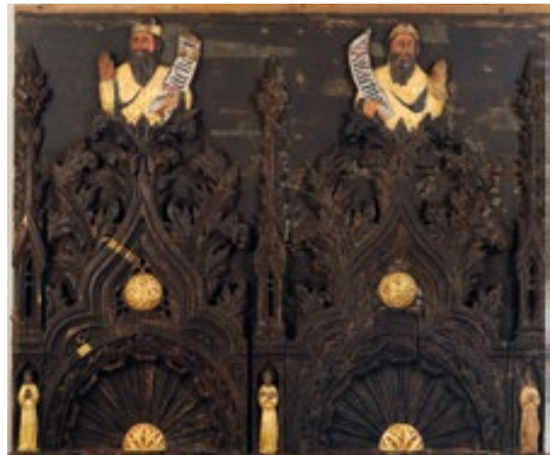
21. Reljef s prorocima Zaharijom i Malahijom nakon konzervatorsko-restauratorskih radova. Relief with prophets Zechariah and Malachi, after conservation

klupe nisu znatnije oštećene. Pregledavajući fotografije iz različitih vremena, zamjećujemo da su dijelovi figura i ornamentike tijekom 20. stoljeća nestali. 43