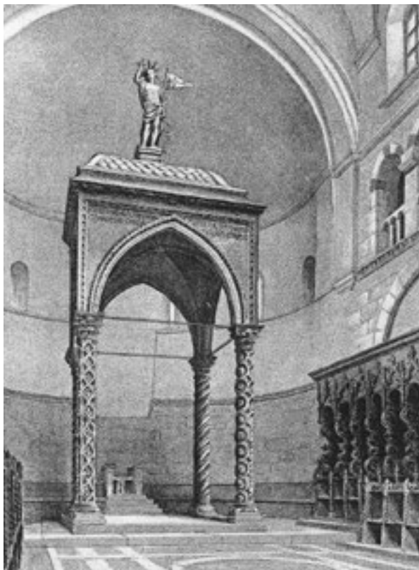
18. Prezbiterij (T. G. JACKSON, Dalmatia, the Quarnero and Istria, 1887.). The presbytery (from: T. G. JACKSON, Dalmatia, the Quarnero and Istria, 1887)

klupa. Između sjedala postavljene su stupiće s pozlaćenim kapitelima. Na osnovi tragova na konstrukciji, fotografija i crteža, jasno je da su se na produžetku izvorno nalazile ćelije odijeljene vegetabilnim pregradama. Potvrdu pretpostavke da su klupe na oba krila završavale ćelijama, za južnu stranu može potražiti u izdanju Thomasa Grahama Jacksona iz 1887. godine 38 (sl. 18). Naime, u knjizi u kojoj autor opisuje gradove koje je proputovao od 1882. do 1885. godine donosi se i niz crteža mjesta koja je posjetio. Pišući o zadarskim spomenicima, T. G. Jackson opisao je katedralu sv. Stošije, a opise je potkrijepio i s nekoliko crteža. Na crtežu dijela prezbiterija katedrale jasno se vidi južna strana korskih klupa, odnosno kraj gornjeg reda južnog krila podijeljenog ćelijama. Ako se uzme u obzir da je T. G. Jackson crtež nacrtao prije obnove, a na fotografiji Tomasa Burata iz 1886. godine pregrada više nema, lako je zaključiti da su ćelije u tom dijelu na oba krila uklonjene u vrijeme radova koje je provodio Oscar Marcocchia.