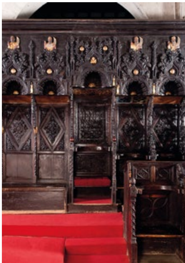
11. Kneževo sjedalo (fototeka HRZ-a, snimio Lj. Gamulin). The Count's seat (Croatian Conservation Institute Photo Archive, photo by Lj. Gamulin)

Budući da su gotovo sva srednjovjekovna korska sjedala tijekom vremena prilično preinačena, često se zaboravlja