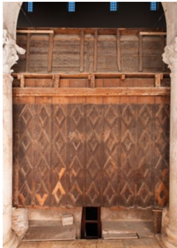
13. Poledina južnog krila. Rear side of the southern wing

caj prilikom uporabe. Velike ravne plohe gornjeg dijela gornjih sjedala bile su obojene svijetlomodro i ukrašene zvjezdicama. Na školjkama su kombinirane svijetlomodra i pozlata, a dijamantni ukras i donji porub bio je jarkocrven. Istovjetna jarkocrvena nalazila se i drugdje na klupama, primjerice na obrubu grba na kneževu sjedalu. 22 Prema tragovima pozlate na više vegetabilnih ornamenata te na fijalama u gornjem dijelu, moguće je da je sav istovrsni ukras bio pozlaćen. Ipak, s obzirom na slabu sačuvanost pozlate, to je nemoguće sa sigurnošću utvrditi.