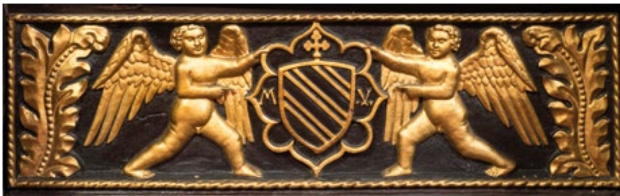
7. Grb nadbiskupa Maffeja Valaressa na nadbiskupovu sjedalu. The coat of arms of Archbishop Maffeo Vallaresso on the Archbishop's seat