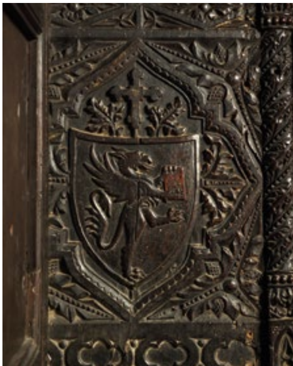
4. Grb nadbiskupa Luke iz Ferma (fototeka HRZ-a, snimio Lj. Gamulin).

The coat of arms of Archbishop Luca of Fermo (Croatian Conservation Institute Photo Archive, photo by Lj. Gamulin)