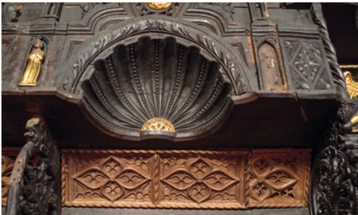
17. Detalj proširenih sjedala pokraj nadbiskupova sjedala. Detail of the extended seats next to the Archbishop's seat

prema laboratorijskim istraživanjima, u prvoj i drugoj repolikromiji nalazi kredno-tutkalna osnova s bolonjskom kredom (gipsom). U prvoj repolikromiji ustanovljena je još cinkova bijela, a moguće i kromna žuta iz polimenta. U drugoj repolikromiji detektiran je cinober kao dio polimenta za pozlatu. 35 S obzirom na prisutnost cinkova bjelila, a možda i kromove žute, taj oslik nije mogao nastati prije kraja 18. stoljeća. Moguće je da je izveden u sklopu velike obnove svetišta i klupa na samom kraju stoljeća.