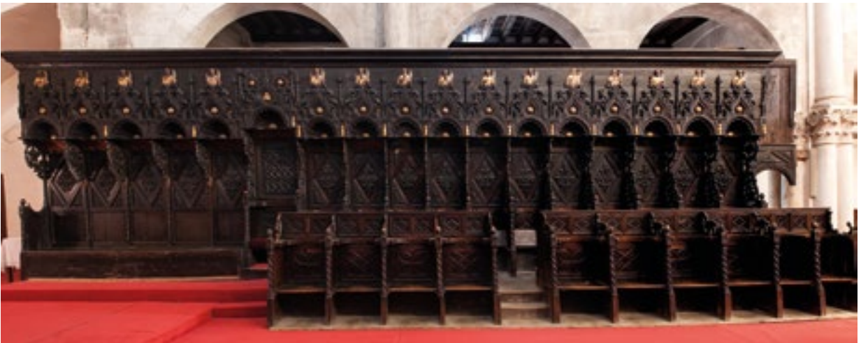
3. Južno krilo. The southern wing

ninama. Majstor Matej u Zadru je ugovarao i izvodio poslove za nadbiskupiju, ali i za druge naručitelje, što može dijelom objasniti dugotrajnost izrade klupa. 12 Čini se da Kaptol nije bio osobito zabrinut Matejevim nepoštivanjem rokova, jer je nekoliko godina poslije, 1426. godine, nadbiskup Blaž Molin od njega naručio raspelo uz koje je trebala stajati Bogorodica i sv. Ivan evanđelist te dvanaestorica apostola, za visoku ogradu prezbiterija – letner – po uzoru na baziliku sv. Marka u Veneciji. 13 Figure je oslikao slikar Ivan Petrov iz Milana, nastanjen u Zadru. 14 Na osnovi te arhivski potvrđene suradnje, pretpostavlja se da je i korske klupe polikromirao isti majstor. 15 Tu pretpostavku potkrepljuje činjenica da je Ivan Petrov bio najbolji slikar koji je u to vrijeme djelovao u Zadru te je zato morao biti prvi odabir za izvođenje tako važnih polikromatorskih radova. Konzervatorsko-restauratorska