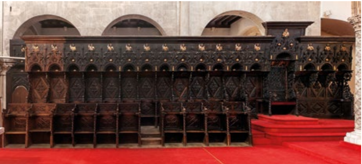
2. Sjeverno krilo. The northern wing