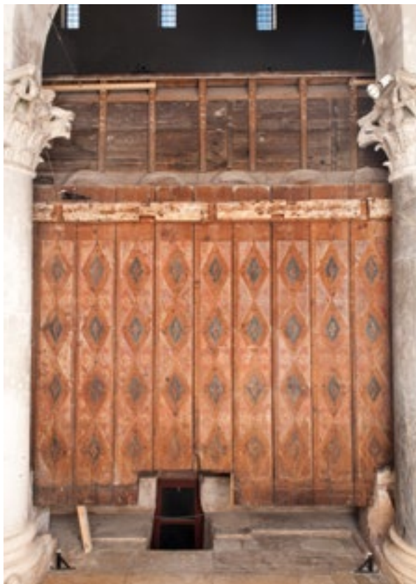
12. Poledina sjevernog krila. Rear side of the northern wing