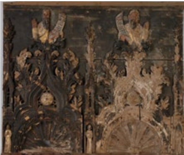
20. Reljef s prorocima Zaharijom i Malahijom prije konzervatorsko-restauratorskih radova. Relief with prophets Zechariah and Malachi, before conservation