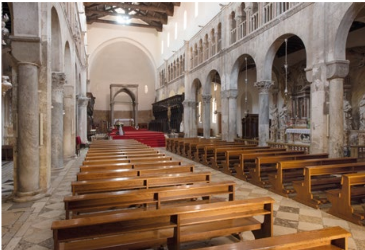
1. Prezbiterij s korskim klupama danas. The presbytery with the choir stalls, present-day

za nadbiskupovo sjedalo. U ugovoru je napomena da će u vrijeme Matejeva boravka u Zadru, zbog rada na koru, za njega i njegovu obitelj biti osiguran smještaj u kanoničkoj kući. Posao je trebao biti završen za osamnaest mjeseci, a ugovorom je dogovoreno da će se novac isplatiti u tri navrata, na početku posla, kad bude završena polovica te nakon završetka posla.