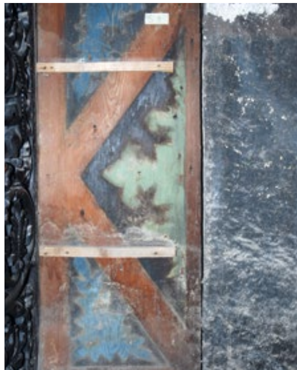
16. Starija pozadina uz otklesani pilastar. The previous back side next to the chiseled-off pilaster

gdje se na kneževu sjedalu umjesto češera nalaze kugle. Međutim, te su kugle nove i sasvim sigurno ne predstavljaju izvorno stanje. 29 Pohranjeni stupić neko je vrijeme stajao kao prvi u redu na južnom krilu, gdje je većim dimenzijama češera remetio ritmični niz, pa je možda i zato poslije uklonjen. 30