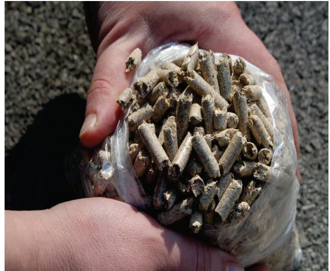
Slika 4. Miscanthus x giganteus u formi peleta