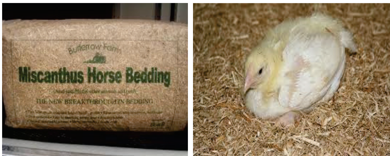
Slika 7. Prostirka za domaće životinje od trave Miscanthus x giganteus