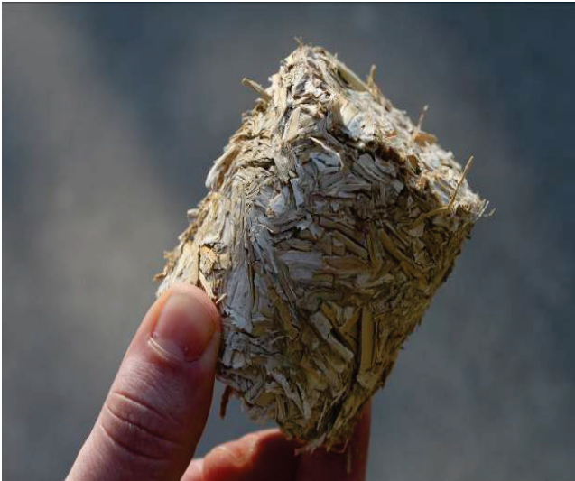
Slika 3. Miscanthus x giganteus u formi briketa

Različite biljne vrste mogu usvajati i koncentrirati različite teške metale, pa čak i radioaktivne elemente (Brooks, 1994).