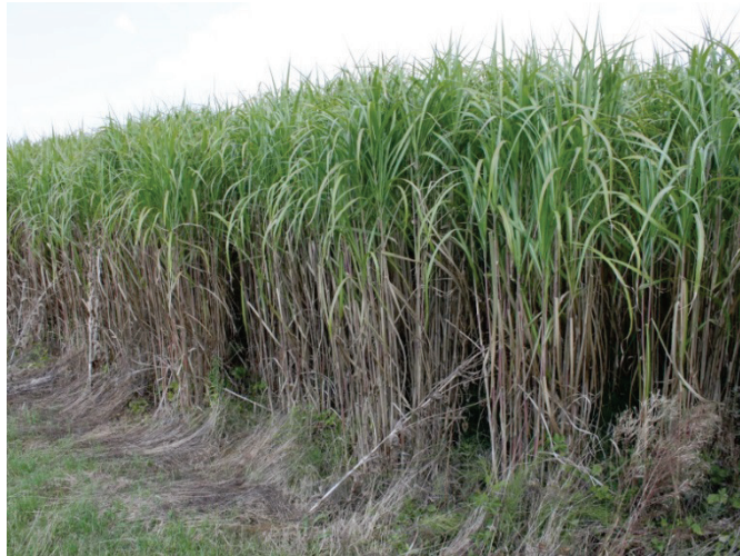
Slika 2. Trogodišnji nasad trave Miscanthus x giganteus

Nadalje, Miscanthus x giganteus je sterilna vrsta, dakle ne postoji mogućnost njegovog ne kontroliranog širenja.