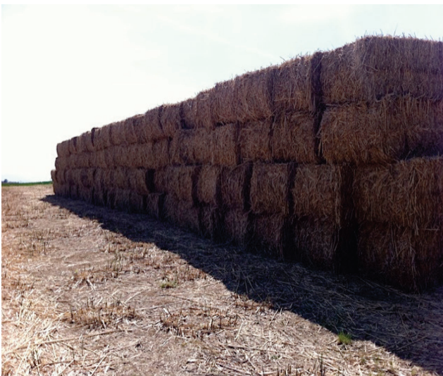
Slika 5. Miscanthus x giganteus u formi bale