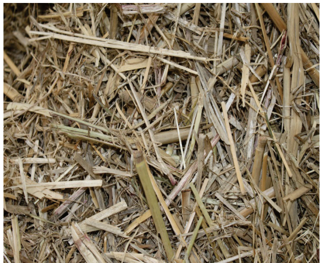
Slika 6. Miscanthus x giganteus u formi sječke