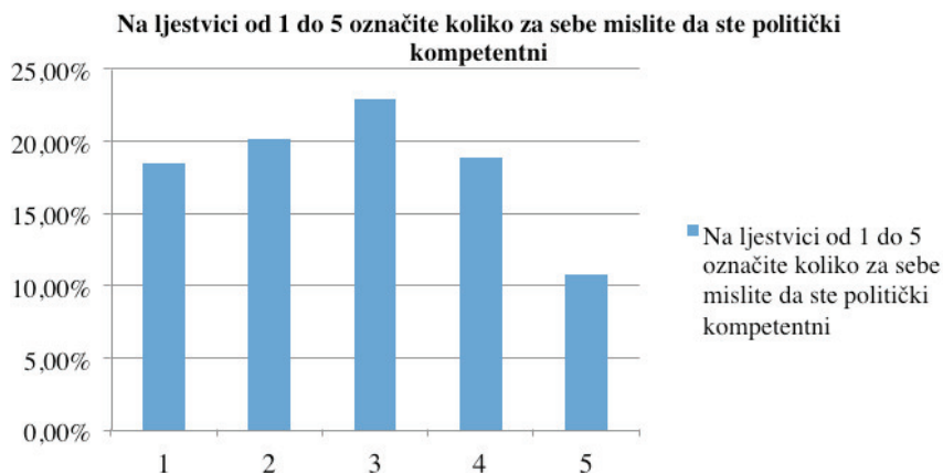
Grafikon 1. Autopercepcija političke kompetencije mladih u Zagrebu

Ovaj nalaz potkrepljuju i nalazi grupnih intervjua, gdje su mladi izjavili da se ne smatraju politički kompetentnim osobama. Uglavnom se u intervjuima ispostavilo da se politička kompetencija izjednačava s političkim znanjem, premda je tu zamjetna razlika u obrazovanju. Studenti smatraju da je politička kompetencija načelna sposobnost i političko znanje, dok je taj zaključak manje prisutan među srednjoškolcima. Iz grupnih intervjua može se zaključiti da mladi poistovjećuju političko znanje s političkom kompetencijom (odnosno smatraju da je činjenično znanje vezano za demokratski sustav dovoljno za aktivno sudjelovanje), da vještine za sudjelovanje u društvu neki prepoznaju, dok stavove niti jedan od ispitanika nije spomenuo kao funkcionalnu dimenziju kompetencije.