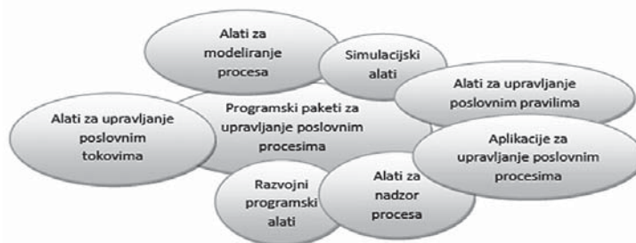
Slika 1. Programski alati orijentirani poslovnim procesima kako ih definira BPTrends 2