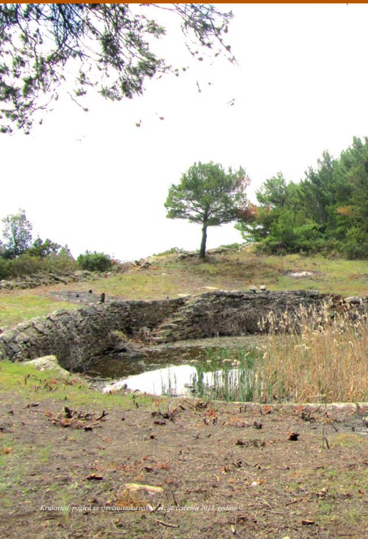
Krušovica, pogled sa sjeveroistoka nakon akcije čišćenja 2013. godine