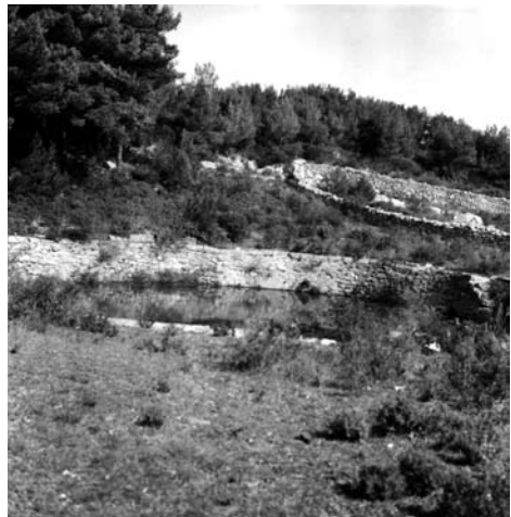
Sl. 8. Stanje 1978. godine