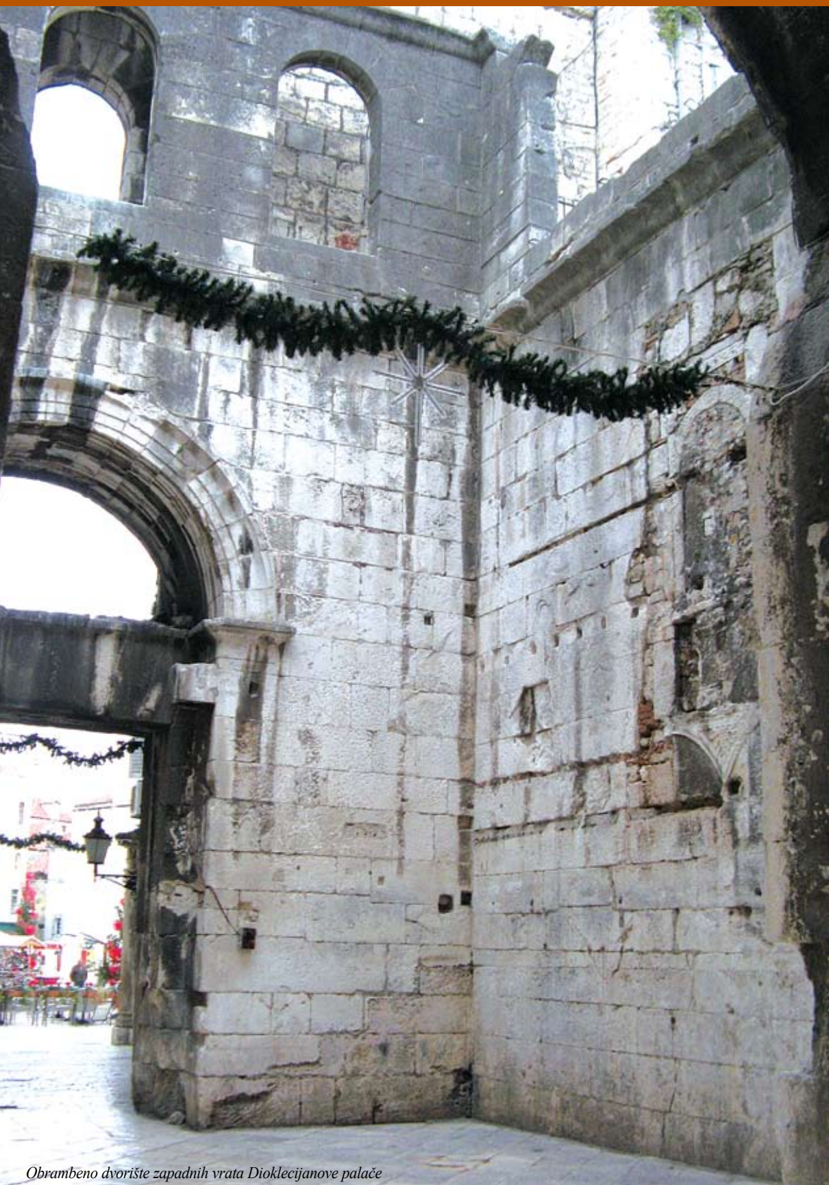
Obrambeno dvorište zapadnih vrata Dioklecijanove palače