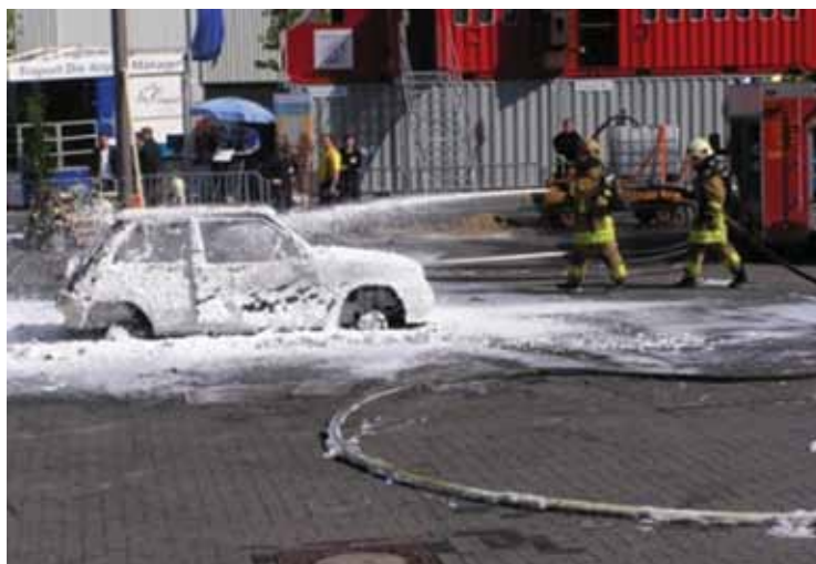
Slika 3. Gašenje požara osobnog vozila komprimiranom pjenom

Požare osobnih vozila i vozila za prijevoz putnika treba sagledavati kroz dva segmenta: gašenje požara i evakuaciju putnika. Govoreći o gašenju vozila u kojima se nalaze osobe, treba voditi računa o vrsti mlaza kojime će se voda ubacivati u vozilo zahvaćeno požarom. Široko raspršeni mlaz ili vodena magla, osim što djeluju ohlađujuće, dobrim djelom djeluju i ugušujuće, naročito vodena magla koja može oduzeti kisik osobama u vozilu. Pjena se rijetko primjenjuje kod manjih "svakodnevnih" požara osobnih vozila. Razlog tomu leži i u vremenu potrebnome da se upostavi mlaz za klasično dobivanje pjene. Pojavom tlačnih vitala za brzu navalu s mogućnošću dobave pjene preko visokog pritiska, te pojavom CAFS-a, povećava se primjena pjene i kod manjih požara. Poznato je da automobilska industrija u želji za praćenjem trendova razvoja mehanike, elektronike, a poglavito ergonomije, poseže za raznim sintetičkim materijalima kod kojih voda neće predstavljati idealno rješenje za gašenje, a sam proces gašenja će biti dugotrajan. Primjenom pjene za gašenje ove vrste požara skraćuje se vrijeme potrebno za gašenje, a pjena na principu prekrivanja oduzima kisik potreban za gorenje i ugušuje požar, slika 3.