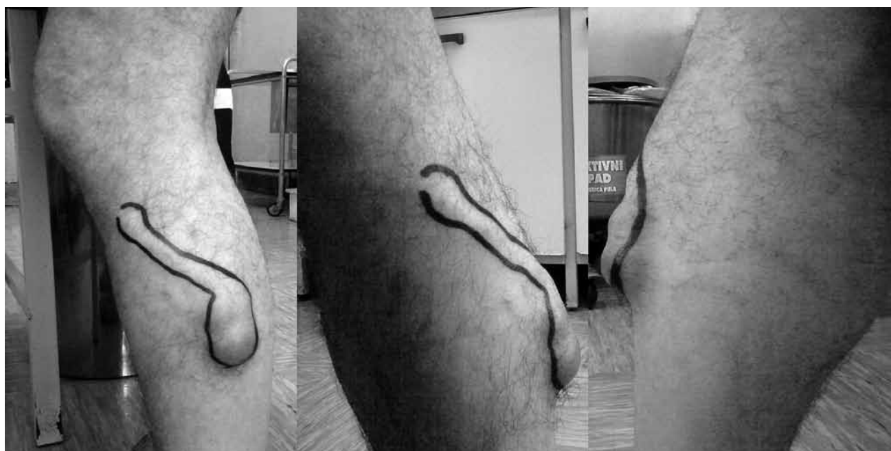
Slika 1, 2 i 3.

Iz specijalističkog nalaza vidljivo je da je pacijent od ranije imao izraženi varikozitet lijeve potkoljenice, te unatrag godinu dana čvorasto zadebljanu venu lateralne strane lijeve potkoljenice, bez znakova crvenila i upale. Stoga je stanje je prvo shvaćeno kao varikoziteti vena (Slike 1, 2, 3), ali uz naručivanje za bolničku obradu, te je planiran UTZ tvorbe, color doppler vena nogu i MSCT angiografija: