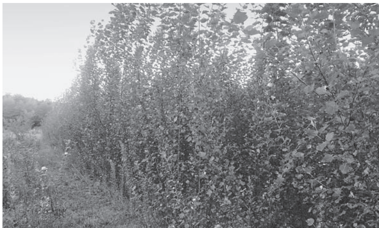
Slika 3. Terenski nasad modificiranih topola sa smanjenim sadržajem lignina osnovan 2007. godine, Orleans, Francuska

Figure 3. Field trial of lignin modified poplars set up in 2007, Orleans, France