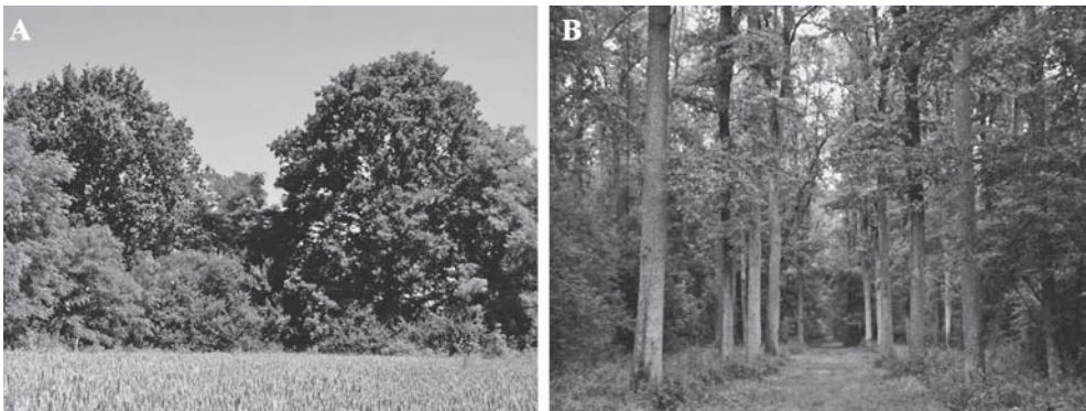
Slika 1. Fenotipski izgled stabala uzraslih uz rub napuštenoga pašnjaka koji otprilike odgovara opisu stabala uzraslih u sastojini u kojoj je Perušić (1917) proveo svoje istraživanje (prikaz A). Fenotipski izgled stabala uzraslih u gospodarskoj sastojini staroj oko 120 godina koji vjerojatno odgovara izgledu stabala u sastojini u kojoj su Matić i dr. (1996a, 1996b) proveli svoje istraživanje (prikaz B).

U vrijeme samih početaka organiziranoga šumarstva u Hrvatskoj problematika izostanka uroda šumskoga drveća, a posebno hrasta lužnjaka, nije bila aktualna samo sa stanovišta problematike pomlađivanja lužnjakovih sastojina (Kozarac 1886, Radošević 1890, Petračić 1906, 1926) već i sa stanovišta svinjogojstva