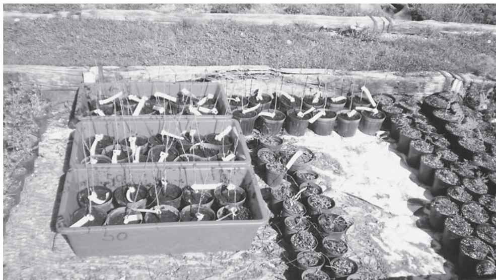
Slika 1. Uzgoj jablana u rasadniku Hrvatskoga šumarskoga instituta Figure 1. Cultivation of poplar in the nursery of Croatian Forest Research Institute

Presadnice jablana posađene su pojedinačno u teglice promjera 16 cm (Slika 1.). Uzgoj je proveden u Hrvatskom šumarskom institutu u Jastrebarskom gdje je sveukupno posađeno 60 presadnica jablana, i to 15 presadnica za svaki maseni udio kadmija u tlu (0 (Kontrola), 10, 25 i 50 mg kg -1 suhe tvari tla). Uzgoj je trajao 55 dana te je prilikom berbe uzimano po 5 cijelih biljaka za svaki maseni udio kadmija.