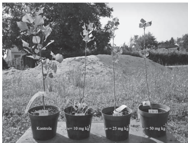
Slika 2. Jablani nakon 55 dana tretiranja različitim koncentracijama kadmija ( w = 0 (Kontrola), 10, 25, 50 \text{mg Cd kg}^{-1} tla) Figure 2. Poplar after 55 days treated with different cadmium concentration ( w = 0 (Control), 10, 25, 50 \text{mg Cd kg}^{-1} soil)

Jablani ( Populus nigra var. Italica ) izloženi različitim masenim udjelima kadmija u tlu ( w = 10, 25, 50 \text{ mg kg}^{-1} suhe tvari tla) pokazali su morfološke i fiziološke promjene nakon 55-dnevnog uzgoja u tlu. Tijekom uzgoja uočeni su vizualni simptomi fitotoksičnosti (Slika 2.). Vrijednosti dobivene za morfološke karakteristike jablana kao što su broj listova, broj izbojaka te promjer listova pokazuju znatno smanjenje ( p < 0,05 ) za maseni udio kadmija od 10 \text{ mg kg}^{-1} , 25 \text{ mg kg}^{-1} i 50 \text{ mg kg}^{-1} suhe tvari tla u odnosu na kontrolu, međutim vrijednosti za visinu pokazuju